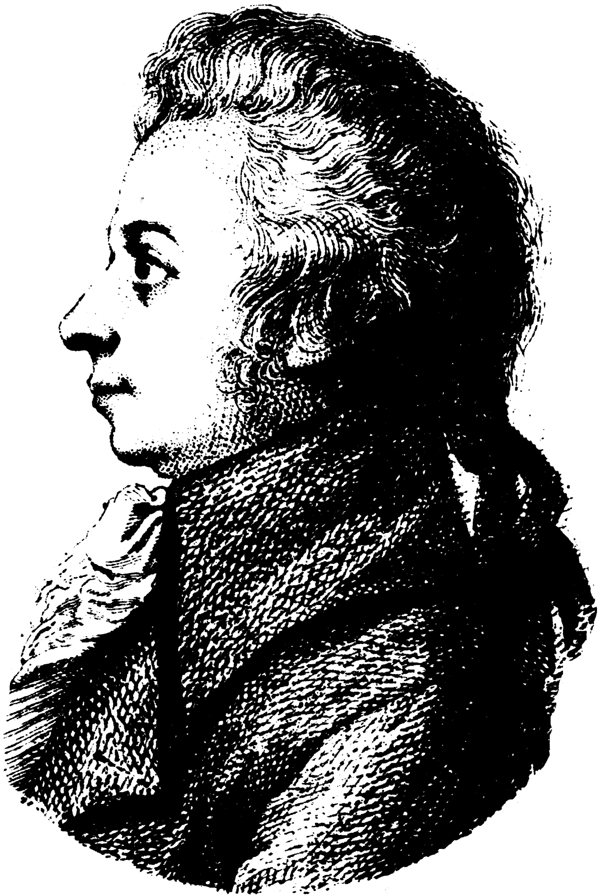
Wolfgang Amadei Mozart