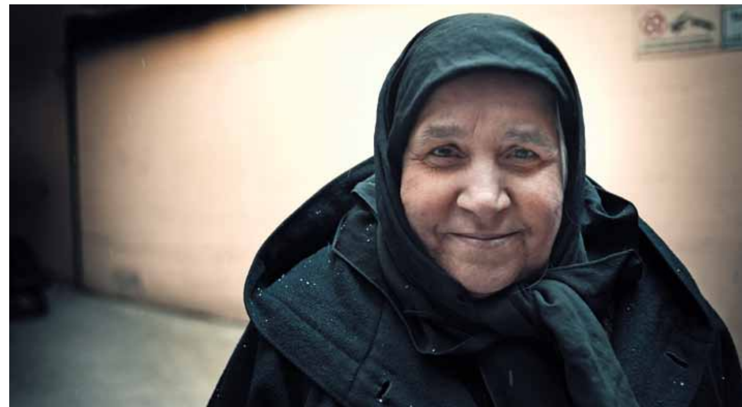
Viele Zuwanderer aus Osteuropa kommen zur Lebensmittelausgabe im Caritas-Zentrum Innenstadt.