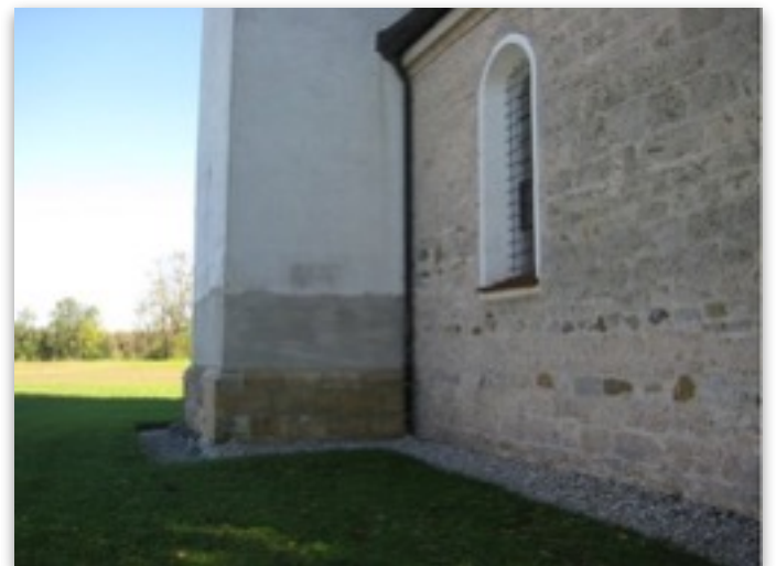
Bild vom Turm in Westerham