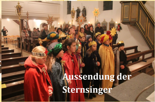
Aussendung der Sternsinger