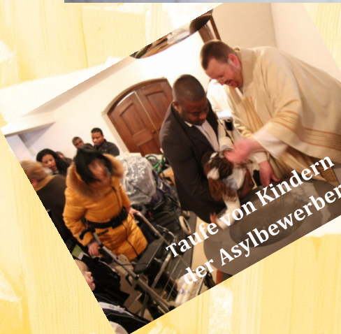
Taufe von Kindern der Asylbewerber