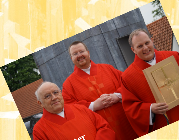
Neuer roter Messornat