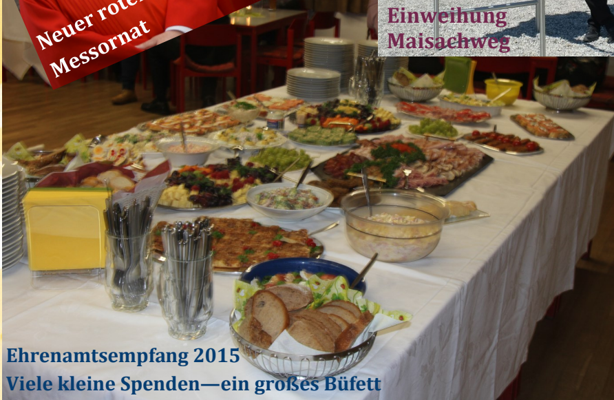
Ehrenamtsempfang 2015 Viele kleine Spenden—ein großes Büfett