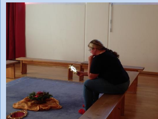
„DIR bin ich kostbar und wertvoll.“