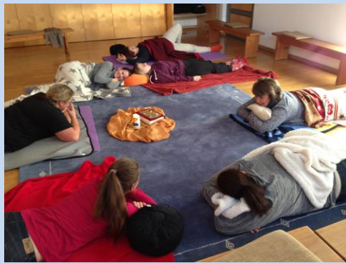
Fantasiereise: Bei dir Gott finde ich Ruhe ...