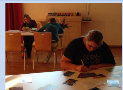
Stationen zur Einzelbesinnung: Kraft schöpfen – die Seele baumeln lassen