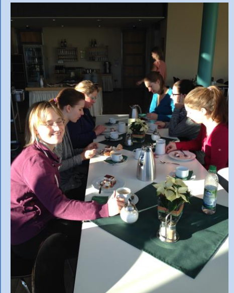
Oasenmomente für das Team