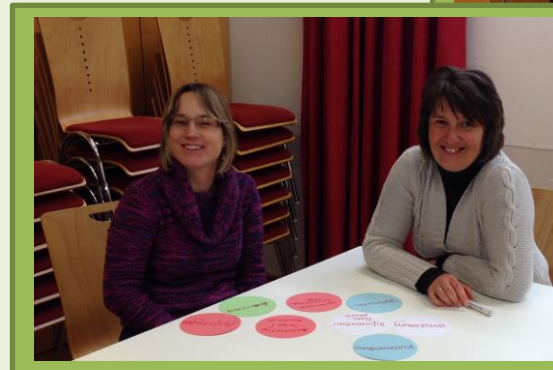
Austausch und Gespräch: „Was hilft uns, unser Netz tragfähig zu machen?“