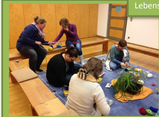
„Netzwerkarbeiten“ – mein Lebensnetz, das mich trägt ...