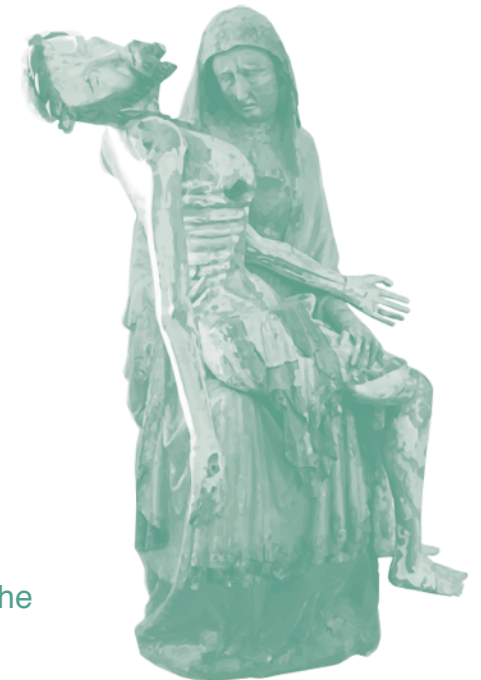
Pieta von 1374 in der Wallfahrtskirche Mariä Himmelfahrt in Salmdorf

Mittag im Seidlhof bei der Pfarrwallfahrt des Pfarrverbandes Isarvorstadt am 7. Mai 2016