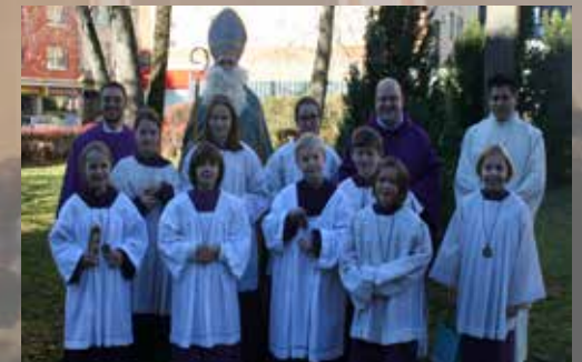
Sogar der Nikolaus war Zeuge, als die fünf neuen Ministranten (vordere Reihe) in ihren Dienst am Altar eingeführt wurden.