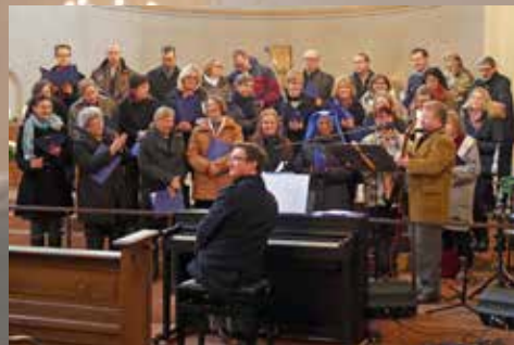
Der Kirchenchor des Pfarrverbands feierte mit der Morus-Messe von Martin Schraufstetter an Christkönig einen großen Erfolg.