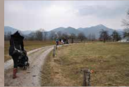
Vom 2. - 4. Oktober ging es wieder in Richtung Miesbach, in das Bauernhaus Berghof in Agatharied. Wie in den letzten Jahren gab es bei dem Familienwochenende ein lockeres Programm aus Freizeit, spirituell-spielerischen Elementen und Bewegung im Wald.