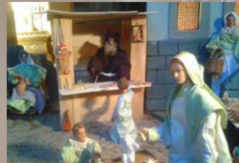
Die Krippe in der Antoniuskirche hatte in diesem Jahr die Herbergssuche auf den Andreasmarkt verlegt. Dort stand sogar ein Kapuziner im Verkaufshäusl, um seine Lebkuchen an Maria und Josef zu verkaufen.