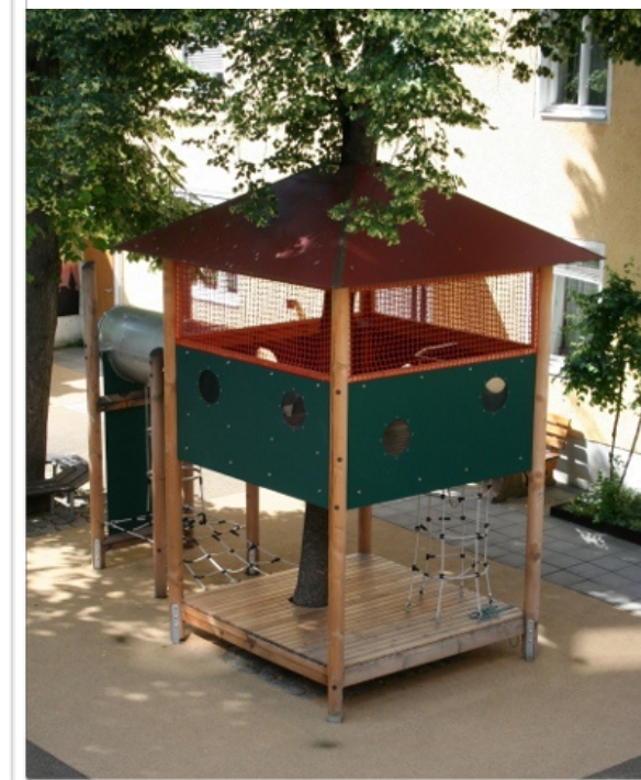
Das Baumhaus ist eine besondere Attraktion im Hof.