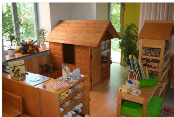
Das Spielhaus in der Sonnengruppe.