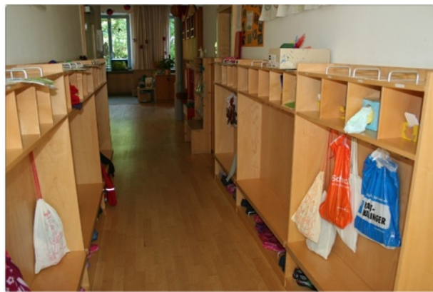
In den hellen Garderoben finden Jacken, Sonnencreme und Elternpost ihren Platz.