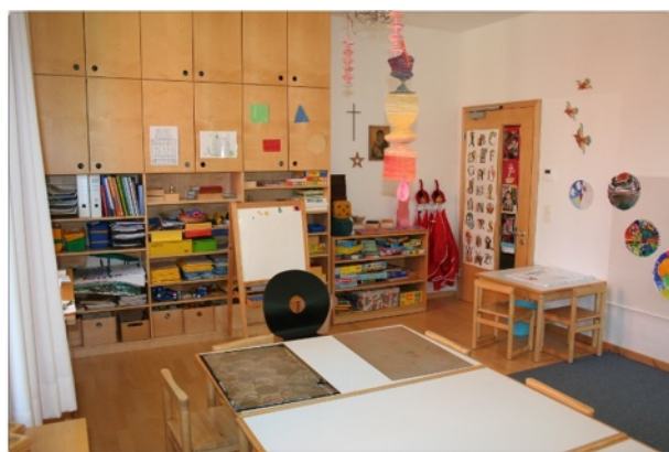
Im Vorschulraum findet auch die Einzelförderung statt.