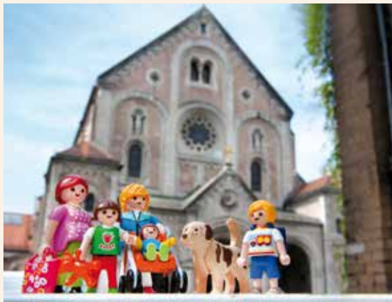
Das Foto links genauso wie unser Titelbild und die Szene auf Seite 4 wurden wieder freundlicherweise von der Fotografin Claudia Göpperl aus unserem Pfarrverband angefertigt. Sie hat ihr Studio in der Thalkirchner Straße 64. Mehr auch auf ihrer Homepage unter www.claudiagoepperl.de