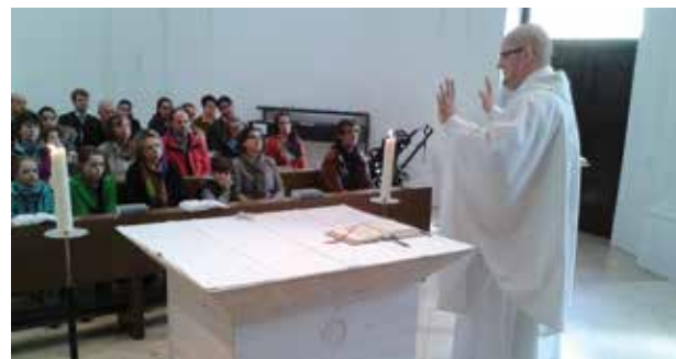
Einmal im Monat findet die „Messe für Ausgeschlafene“ in der Schmerzhafte Kapelle statt, die sich wachsender Beliebtheit erfreut.

zugezogene oder religiöse „Wiedereinsteiger“ – und eben für von der Arbeitswoche ermüdete Langschläfer. Beim letzten Schlag 12 sagte eine regelmäßige Kirchgängerin: „Ich kenne hier die Hälfte der Menschen nicht. Das finde ich gut!“ Die Möglichkeit zum Kennenlernen gibt es dann beim anschließenden Mittagessen in einem Restaurant in der Nähe. Ganz entspannt, ohne Voranmeldung, mal bayrisch, mal italienisch, mal asiatisch. Die nächsten Termine für Schlag 12 stehen schon fest. Denn das erste Jahr hat gezeigt: Ausschlafen, Glauben feiern und den Sonntag genießen, das geht sehr gut zusammen.