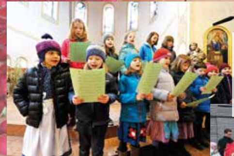
Palmsonntag im Pfarrverband: Mit Palmbuschen-segnung im Hof von St. Anton, Kinderchor in der Kirche und Palmesel Matthias, der auf dem Weg von St. Andreas zu lahmen anfang, weil er ein Rad verloren hatte. Mittlerweile ist er aber wieder genesen.