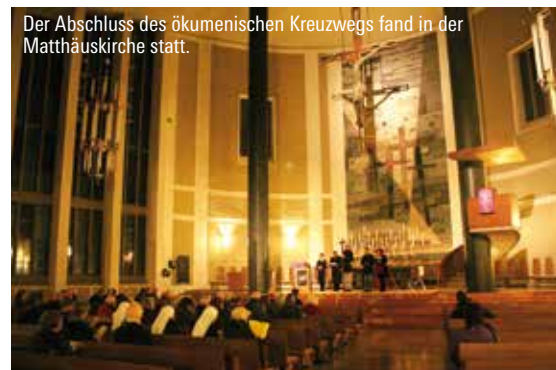
Der Abschluss des ökumenischen Kreuzwegs fand in der Matthäuskirche statt.