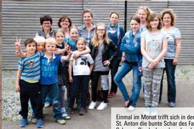
Einmal im Monat trifft sich in den Remisen von St. Anton die bunte Schar des Familienkreises. Schauen Sie doch auch mal vorbei (Termine auf S. 12)