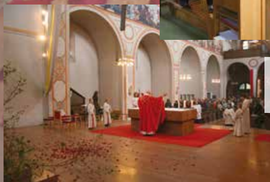
Auch heuer regnete es zu Pfingsten Rosenblätter im Gottesdienst in Erinnerung an die Feuerzungen des Evangeliums. Gestaltet wurde der Gottesdienst vom Kirchenchor des Pfarrverbands.