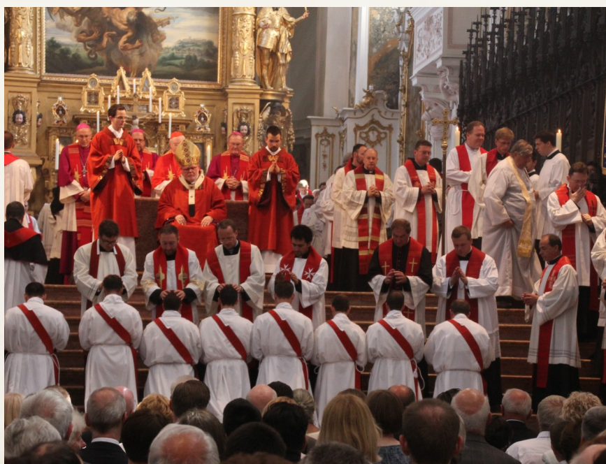
Priesterweihe im Freisinger Dom am 25.Juni 2016