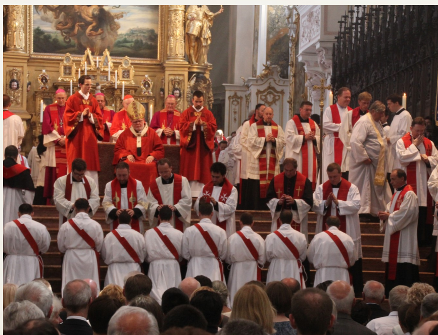
Priesterweihe im Freisinger Dom am 25.Juni 2016