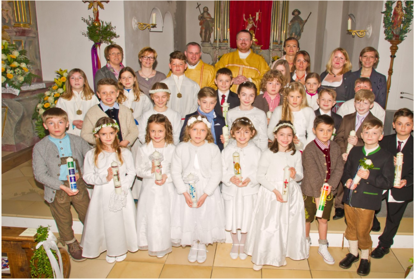
Kommunionkinder am 3. April in Schwabhausen

Ich verstehe es nicht, ich fasse es nicht, und doch ist es da, kann nicht gelegnet werden.