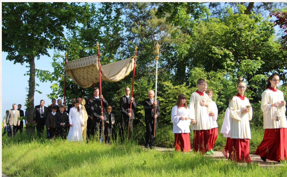
Prozession in Oberroth

Wir danken allen Familien, die sich für die liebevolle Gestaltung und Ausschmückung von Hausaltären immer wieder einsetzen und damit die Fortführung dieses ehrwürdigen und sinnvollen Brauches ermöglichen.