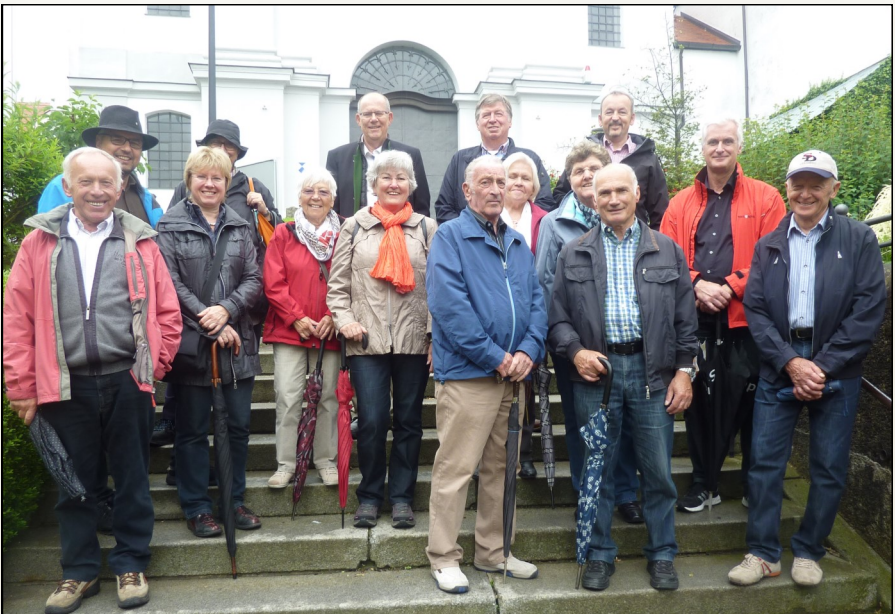
Die interessierten Teilnehmer des Kultourausflugs

Alles in allem eine interessantes und rundum lohnendes Ausflugsprogramm, das die Oberrother mit einer gemütlichen Brotzeit im Gasthof Maierbräu ausklingen ließen.