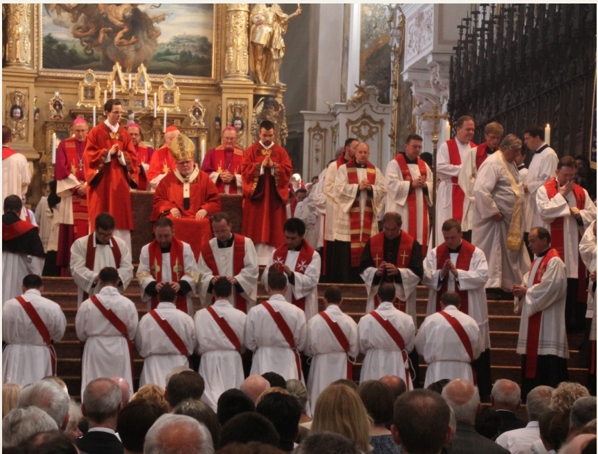
Priesterweihe im Freisinger Dom am 25.Juni 2016