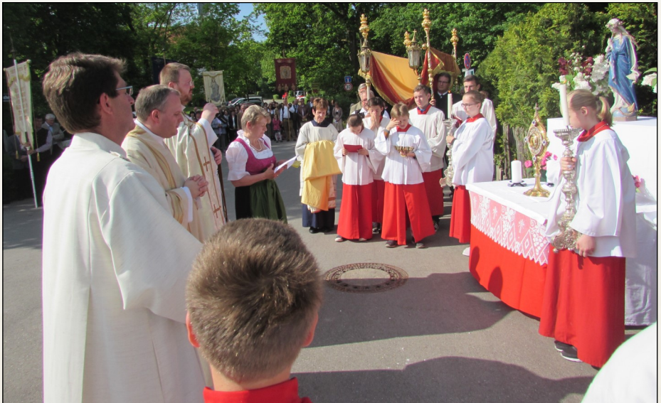
Erster Segensaltar in Bergkirchen