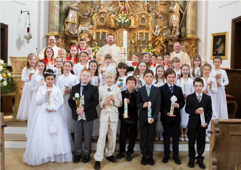
Kommunionkinder am 3. April in Bergkirchen

Wunder von Heilung und Rettung, aus tückischer Krankheit, aus zerbrochener Beziehung, aus Krieg und Gefangenschaft.