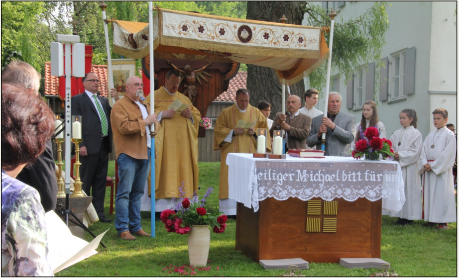
Heilige Messfeier im Schwabhauser Pfarrgarten