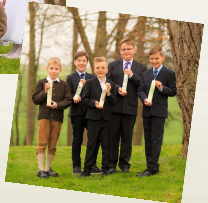
Kommunionkinder am 10. April in Schwabhausen