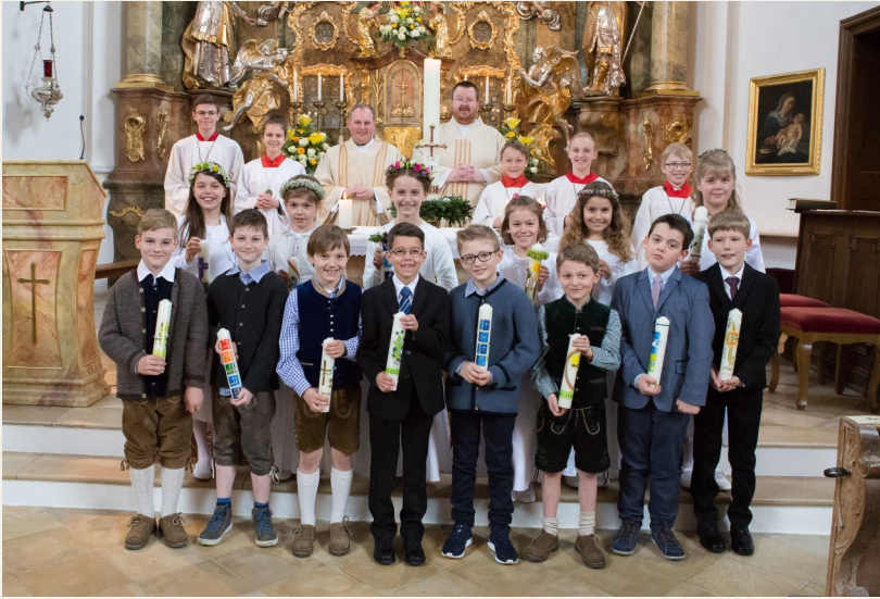
Kommunionkinder am 10. April in Bergkirchen

Wunder der Wandlung von Böse zu Gut, vom Verlorenen zum Gefundenen, von Verzweiflung zu Hoffnung, von Brot und Wein in Seine Gegenwart.