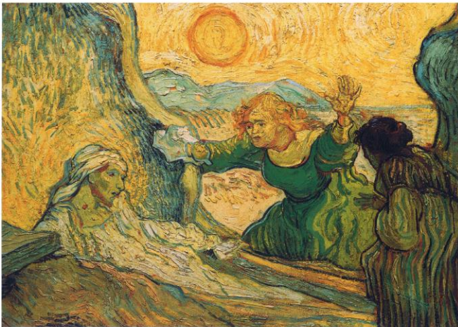
Vincent van Gogh, Die Auferweckung des Lazarus , 1890