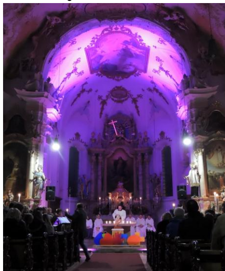
Kreisjugendgottesdienst in Rattenkirchen