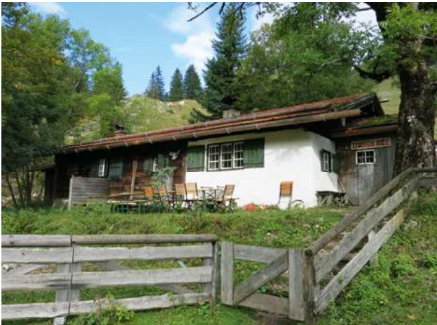
Kirchenrat-Doerfler-Hütte am Wendelstein