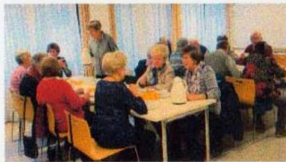
Kolping feiert runde Geburtstage am 11.11.2017