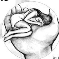
In Gott geborgen