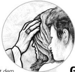
Mit dem Geist gesalbt