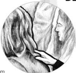
Vom Paten gestützt