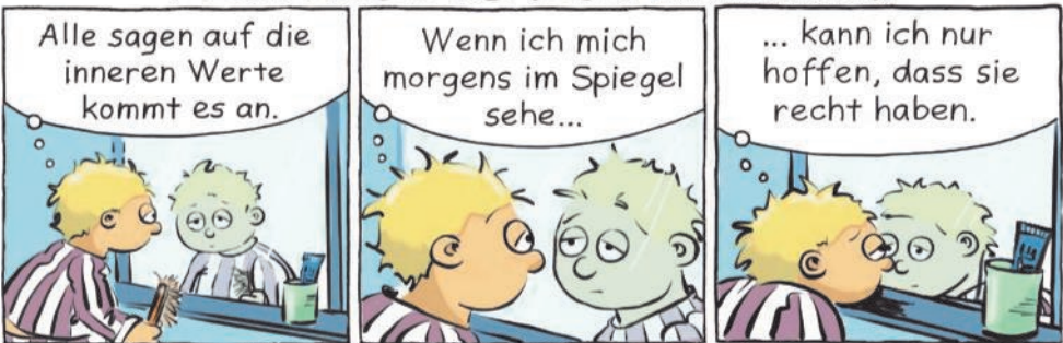
Grafik: Waghubinger, Image