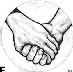
In der Gemeinde vereint