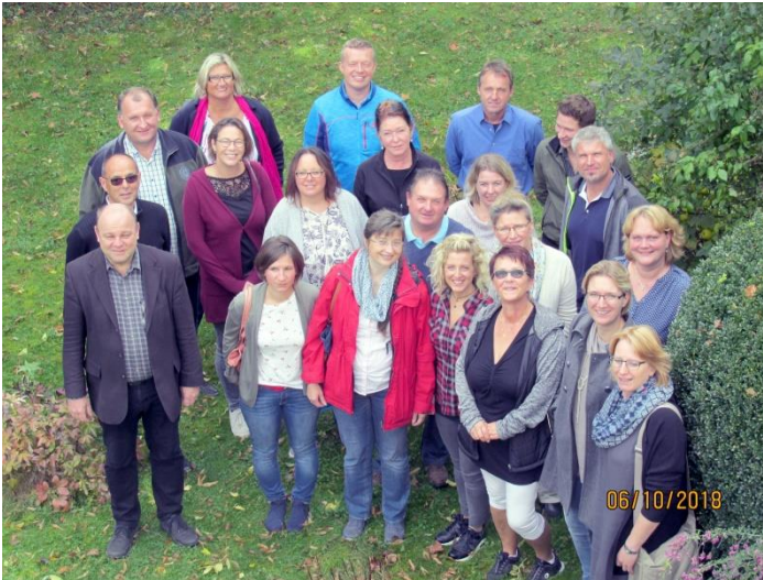
Die neuen Pfarrgemeinderäte (PGR)

Ja, weil es allen wichtig war, darum haben sich an einem sonnigen Herbsttag im Oktober die Pfarrgemeinderäte vom Pfarrverband Steinhöring und die hauptamtlichen Mitarbeiter zusammengefunden und Zeit genommen sich über ihr Tun Gedanken zu machen.