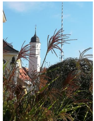
Blick vom Pfarrgarten zur Kirche