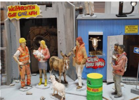
Bild: Krippe: Rudi Bannwarth / Foto: Wolfgang Cibura In: Pfarrbriefservice.de

„In der Menschheit lebt und verwirklicht er die Konsequenz der Liebe, um ihre aus Abgründen rettende, heilende, versöhnende Macht und damit ihre letzte beseligende Tiefe offenbar zu machen.“