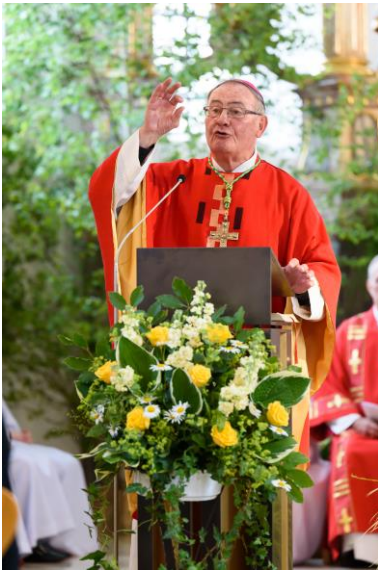
Weib. Haßberger Firmung 2017 Pfarrkirche St. Gallus, Steinhöring

Die Firmung findet statt am 05. Juli 2019