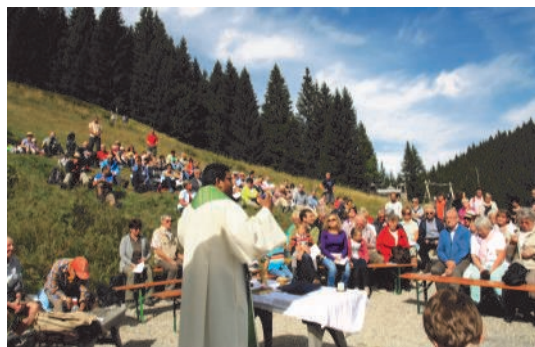
Bergmesse am Kolbensattel 2015.