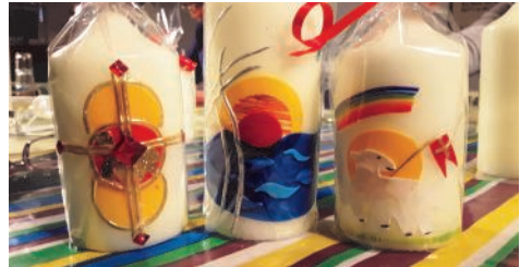
Osterkerzen 2019

Der katholische Frauenbund verkauft wieder Palmbuschn und der Pfarrgemeinderat Osterkerzen.