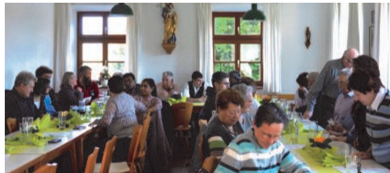
Pfarrversammlung am 17. März