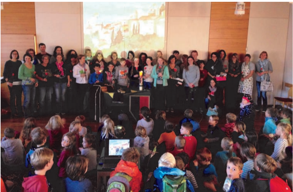
Herzlicher Dank an alle Mitarbeiter/-innen