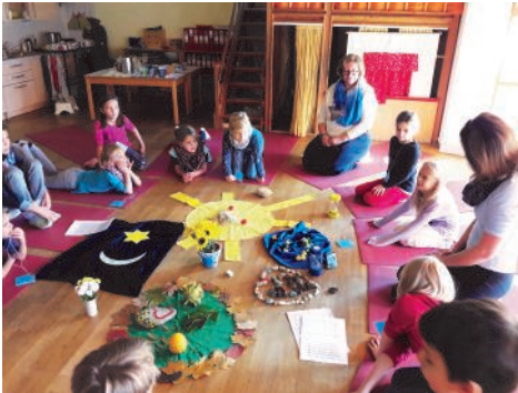
Gruppenarbeit