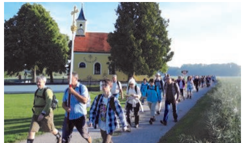
Die Wallfahrer im letzten Jahr am Zellhof.

Bald ist es wieder soweit: Am Samstag, den 11. Mai findet heuer die Fußwallfahrt von Maisach nach Andechs, dem ältesten Wallfahrtsort in Bayern, statt. Treffpunkt ist um 04:50 Uhr vor der Pfarrkirche St. Vitus. Nach der Segnung der Teilnehmer geht es wie immer um 05:00 Uhr los, und um 14:30 Uhr wird in der Klosterkirche Andechs der Wallfahrtsgottesdienst gefeiert.