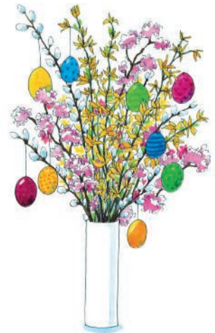
Grafik: Ines Rarisch, Image

Möge das neue Leben des Ostermorgens auch in Ihrem Alltag blühen. Gesegnete Ostern!