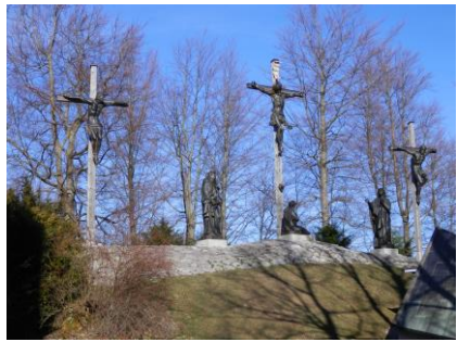
Gemeinsam auf dem Pilgerweg zum Kalvarienberg