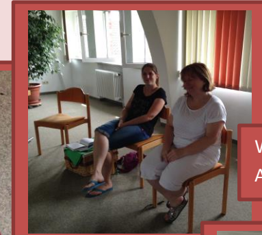
Wort-Gottes-Feier: Aus der Stille leben