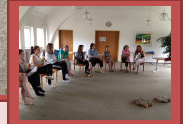
Austausch: Wo sind meine Ruheorte? Woher ziehe ich meine Kraft?