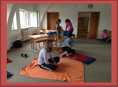
Meditation und Entspannung: Ein Ort der Stille ist in mir.