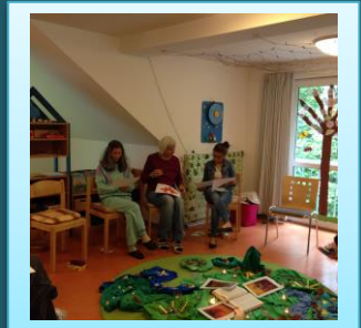
Gottesdienst feiern: Kommt mit an einen einsamen Ort und ruht ein wenig aus.