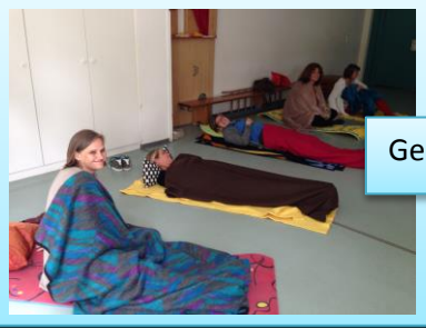
Gemeinsam die Stille hören, meditieren, betrachten