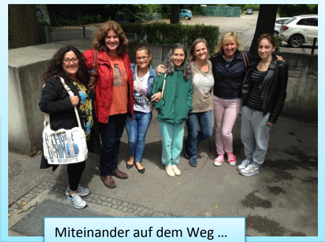
Miteinander auf dem Weg ...