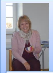
Einstiegsrunde: „Was wünsche ich mir für den heutigen Tag?“