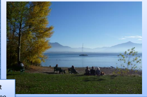
Spaziergang mit Ruhepause am See