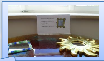
Meditation, Entspannung, zur Ruhe kommen, Stationen zum Thema