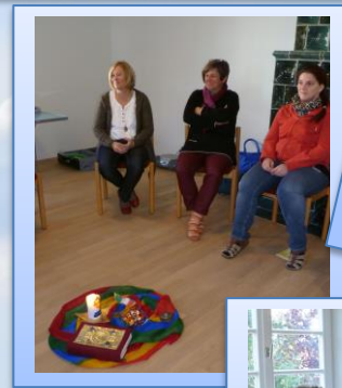
Austausch: „Wo finde ich Ruhe? Was gibt mir Kraft? Was kann uns als Team helfen?“