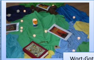
Wort-Gottes-Feier: Kommt mit an einen einsamen Ort und ruht ein wenig aus. Mk 6,31