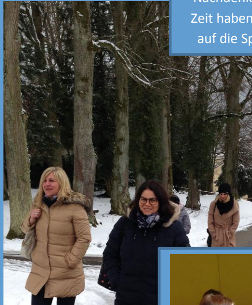
Austausch, frische Luft und gutes Essen halten Leib und Seele zusammen ...