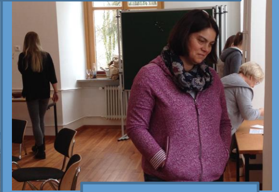
... meine Talente, meine Licht- und Schattenseiten, mein gesamtes Leben – von Gott geliebt ... Und von mir?