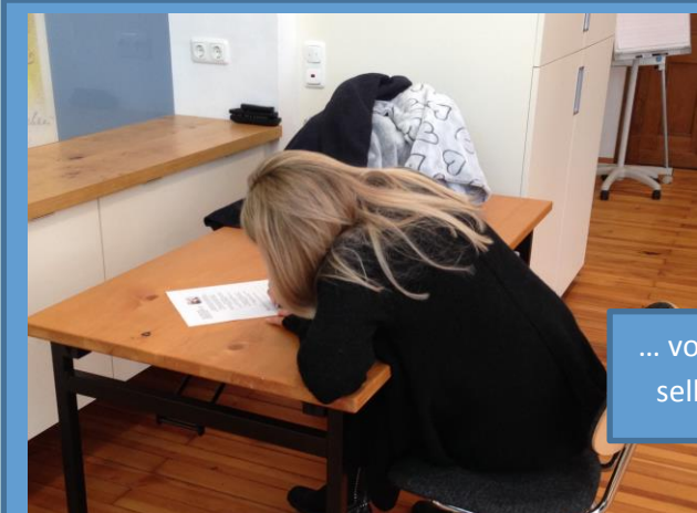
... von der Kunst, sich selbst zu mögen ...