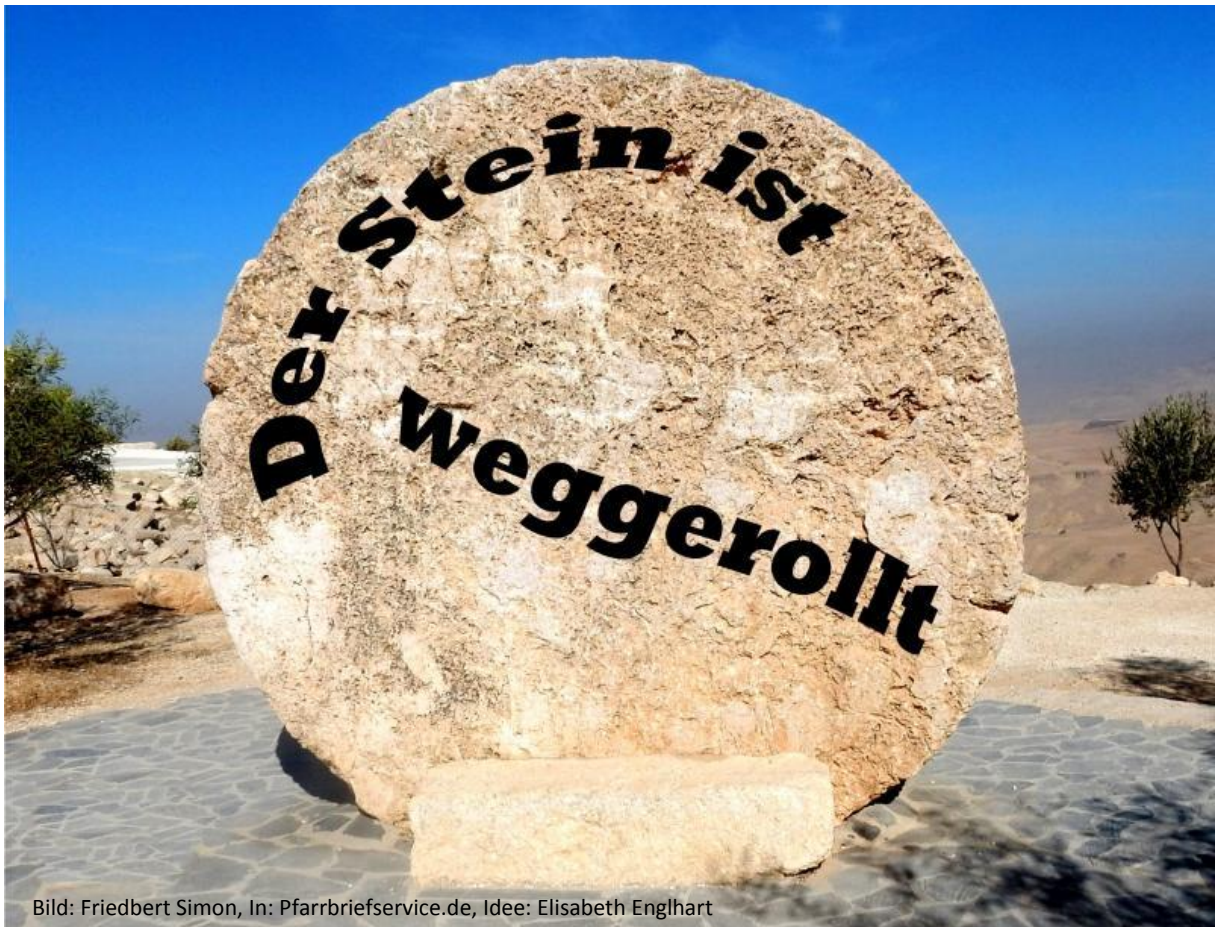
Bild: Friedbert Simon, In: Pfarrbriefservice.de, Idee: Elisabeth Enghart

Markus 16, 2-4: Am ersten Tag der Woche kamen sie in aller Frühe zum Grab, als eben die Sonne aufging. Sie sagten zueinander: Wer könnte uns den Stein vom Eingang des Grabes wegrollen? Doch als sie hinblickten, sahen sie, dass der Stein schon weggerollt war; er war sehr groß.