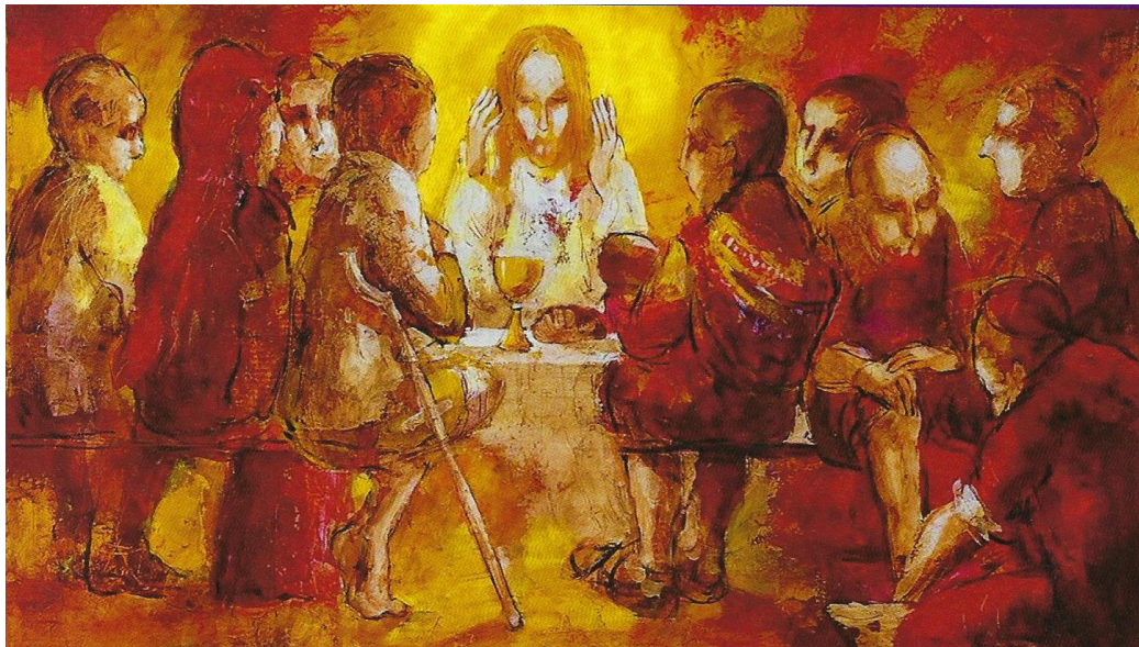
MISEREOR Hungertuch 2013/14: „Wie viele Brote habt ihr?“ (Ausschnitt) von Ehti Stih © MISEREOR 61 Li.: Fotolia/Reddogs; re.: epd-bild/Michael Wolfsteiner

In deinem Schulbuch (fse 3) findest du auf der Seite 57 die folgende Abbildung: