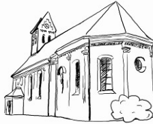
St. Peter und Paul