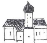
St. Laurentius, Haindlfing