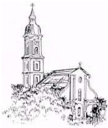
St. Peter und Paul, Freising-Neustift