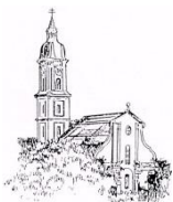
St. Peter und Paul, Freising-Neustift