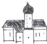
St. Laurentius, Haindlfing