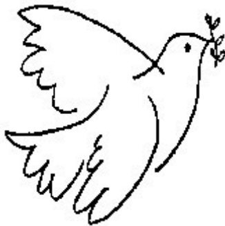
„Paloma de Paz Blanca“ von Pablo Picasso

am Sonntag, 8. Januar 2021, um 19 Uhr Pfarrkirche Maria Himmelfahrt