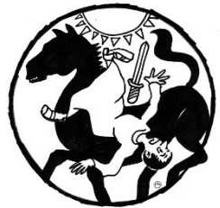
Bekehrung des Apostels Paulus