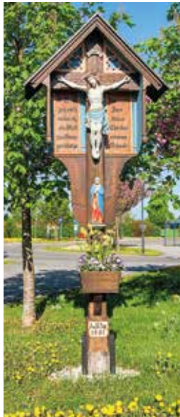
Scheirer Kreuz, Putzbrunn