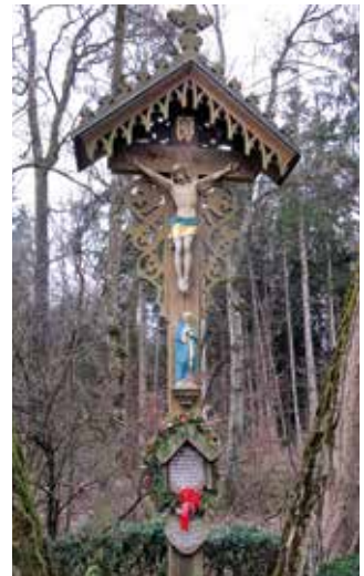
Kreuz der Familie Eder, Oedenstockach