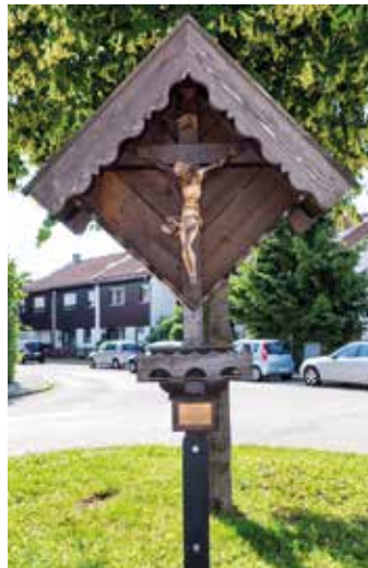
Kreuz Rathausstraße, Putzbrunn

Flurstraße aus Putzbrunn kommend am Beginn der Bebauung