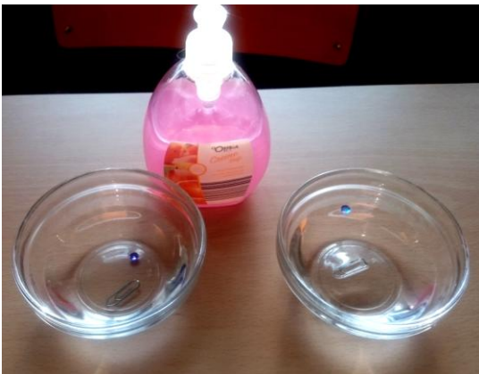
Experiment zur Oberflächenspannung