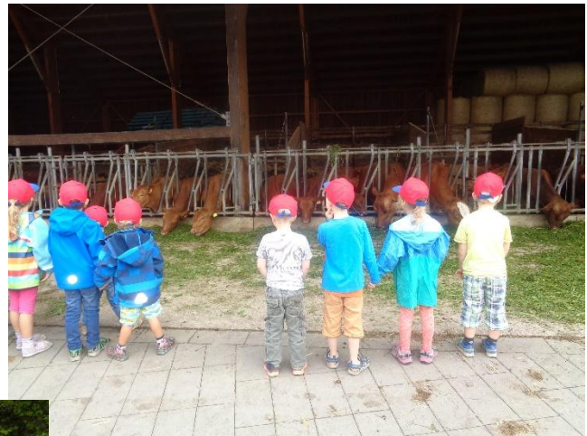
Besuch auf dem Bauernhof