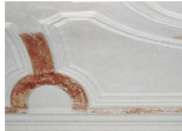
HAUPTRAUMDECKE, FREIGELEGT, DETAIL