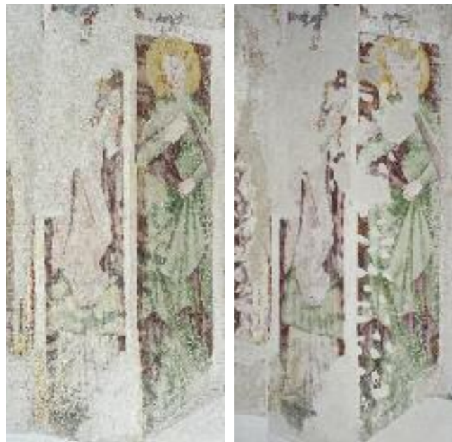
HLL. BRICIUS UND APOLLONIA. ZWISCHENZUSTAND VORZUSTAND