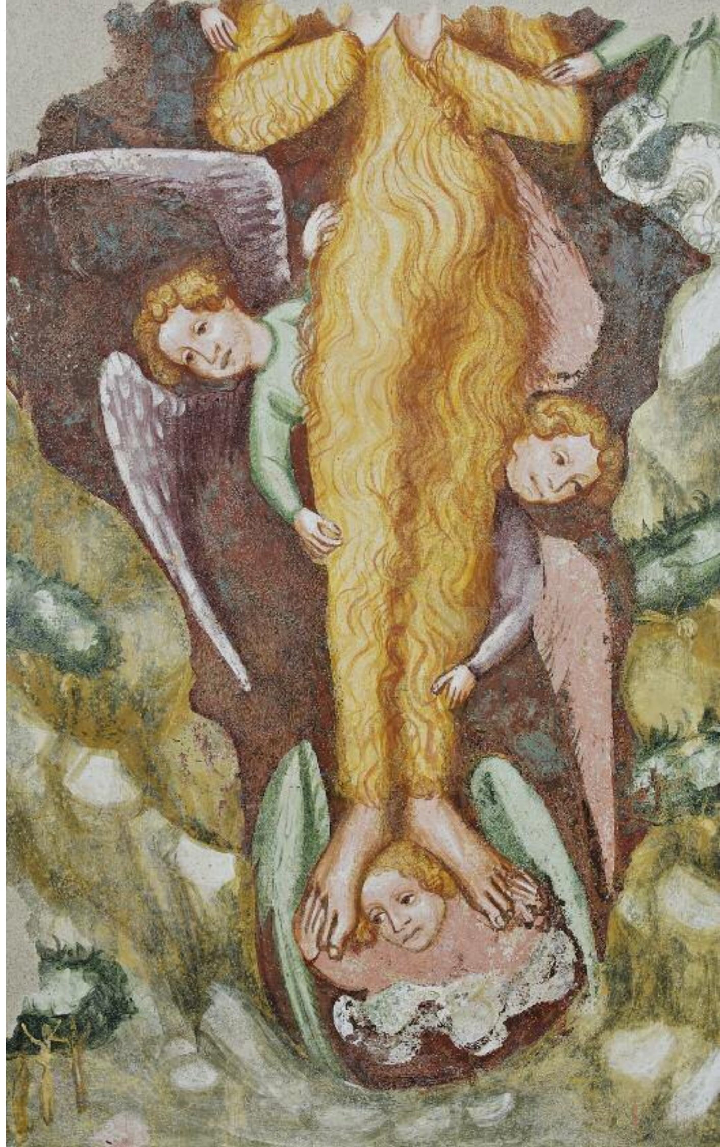
HL. MARIA MAGDALENA. SCHLUSSZUSTAND