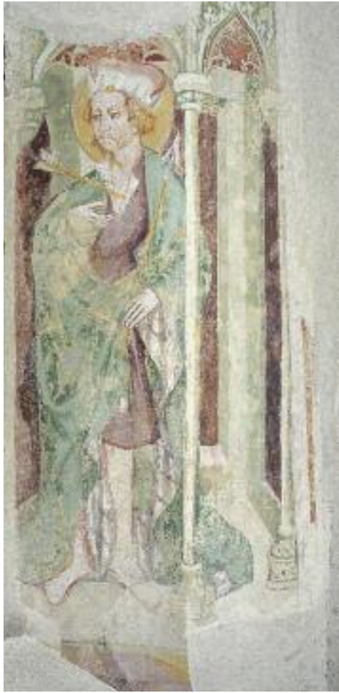
HL. SEBASTIAN. VORZUSTAND