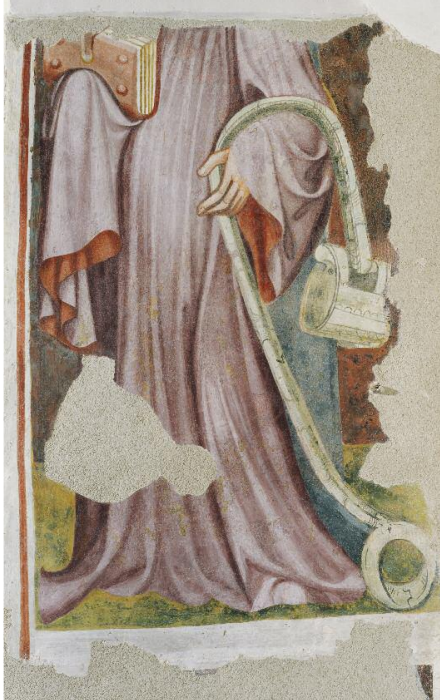
HL. LEONHARD. SCHLUSSZUSTAND