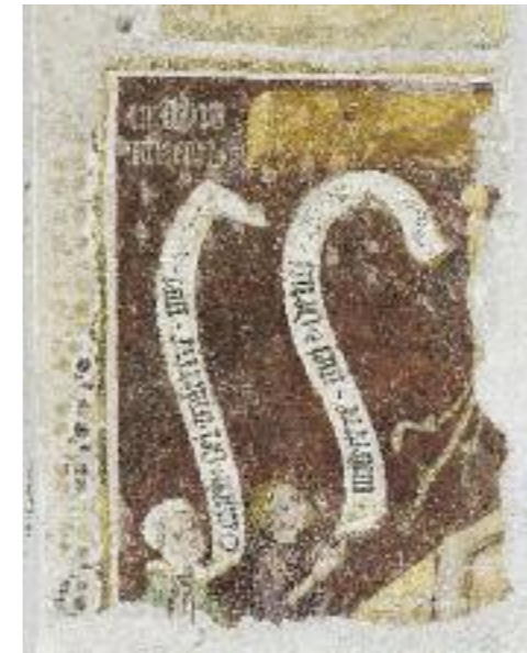
SCHMERZENS MANN VON 1408. VORZUSTAND