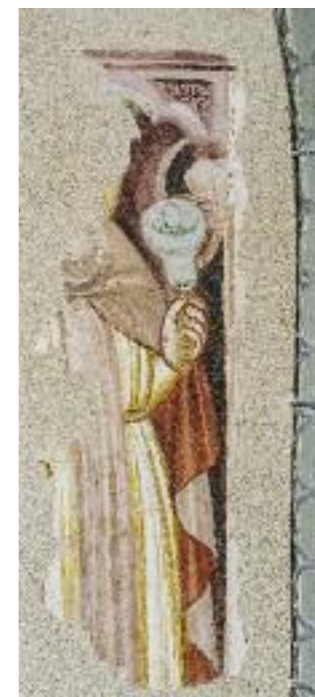
HL. ANTONIUS, SCHLUSSZUSTAND