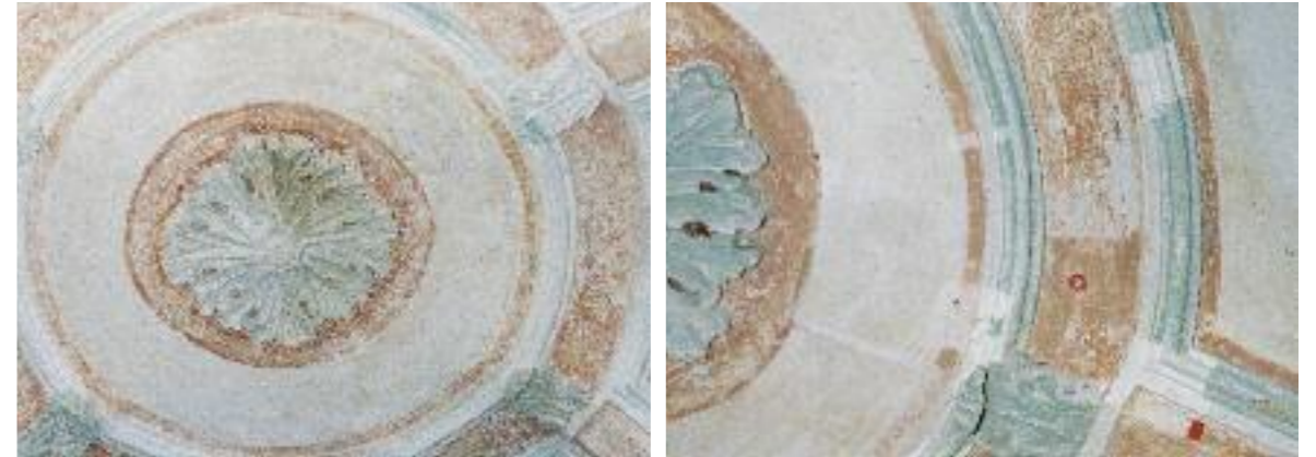
STUCKFASSUNG IM PRESBYTERIUM, VORZUSTAND, DETAIL