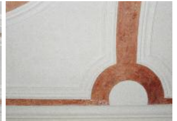
HAUPTRAUMDECKE, RETUSCHIERT, DETAIL