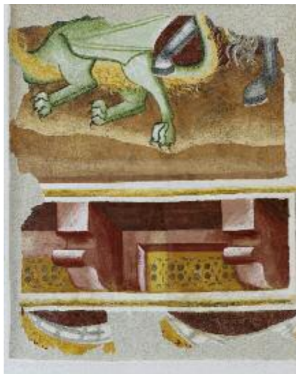
DRACHENKAMPF DES HL. GEORG, SCHLUSSZUSTAND