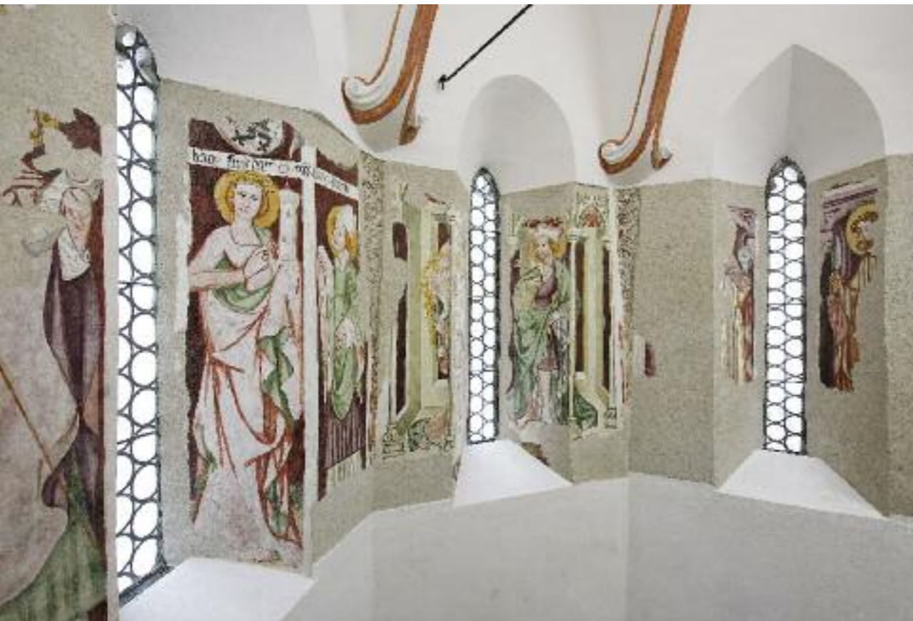
WANDMALEREIEN IM PRESBYTERIUM. SCHLUSSZUSTAND