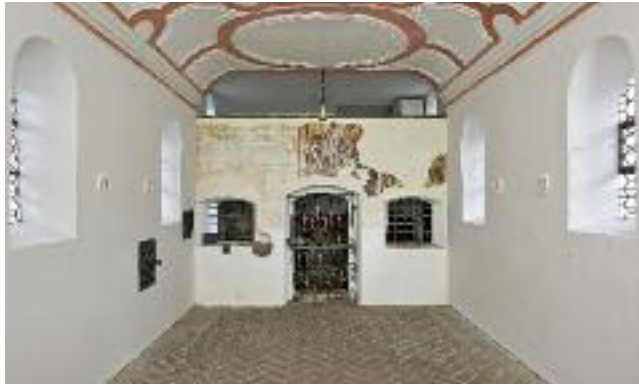
ANSICHT NACH WESTEN. SCHLUSSZUSTAND (NOCH OHNE GESTÜHL)