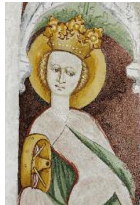
HL. KATHARINA, SCHLUSSZUSTAND, DETAIL