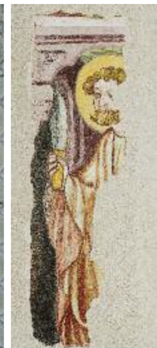
HL. BARTHOLOMÄUS, SCHLUSSZUSTAND

Auch die beiden folgenden Heiligenbildnisse sind scheinarchitektonisch gerahmt, die Rahmungen aber weniger reich gestaltet. Das linke Bildfeld ist stark fragmentiert. Der Gewandrest mit dem T-förmigen Umhang und das Attribut Glocke aber weisen auf den hl. Antonius hin. Die Reliquien des Eremiten haben den Sohn eines Edelmanns vom sogenannten Antoniusfeuer geheilt, einer im Mittelalter häufigen, durch vom Mutterkorn verunreinigtes Getreide hervorgerufenen Vergiftung, die Wahnvorstellungen zur Folge hat. Mit der Glocke kündigt er sein Kommen und seine Hilfe an, weswegen sie ihm attributiv beigegeben wird. In der Laibung gegenüber ist der hl. Apostel Bartholomäus mit seinem Attribut zu sehen, dem Messer, mit dem ihm bei seinem Martyrium die Haut abgezogen wurde. Er gilt, wie Antonius, bei Nervenkrankheiten als Nothelfer. Da beide Heilige sich der Nervenkranken annehmen, kann man vielleicht einen speziellen Bezug zu einem Stifter vermuten.