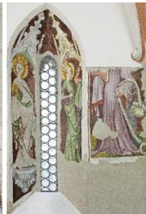
MALEREIEN AM SÜDFENSTER, SCHLUSSZUSTAND

Die beiden Figuren in der Laibung des Westfensters des Presbyteriums sind ebenfalls scheinarchitektonisch gerahmt. Auf krabbenbesetzten Konsolen (eine hat sich erhalten) stehen zwei weibliche Heilige und werden überfangen von Fialen flankierten kielbogigen Arkaden mit Wimberg und Kreuzblume. Links ist die hl. Katharina zu sehen, rechts die hl. Margaretha. Beide weisen ihre Attribute mit von Gewandstücken verhüllten Händen vor. Katharina hält in der Rechten das Rad, das zu ihrer Marterung vorgesehen ist, aber von einem Blitz zerstört wird, sowie das Schwert ihrer Enthauptung. Margaretha zeigt den Drachen, in dessen Gestalt ihr der Teufel erscheint, der von ihr überwunden wird. Die beiden Heiligen gehören zu den 14 Nothelfern: Katharina beschützt die Mädchen, Jungfrauen und Ehefrauen. Margaretha steht den Gebärenden und den Verwundeten bei. Zusammen mit der hl. Barbara bilden die hll. Katharina und Margaretha die Gruppe der Virgines Capitales, der im Alpenraum sogenannten „drei heiligen Madln“, denen jeweils die Erhörung all ihrer Fürbitten zugesagt ist, weswegen ihnen besondere Verehrung zukommt.