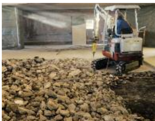
SCHADENSBIEDER UND BAULICHE INSTANDSETZUNG