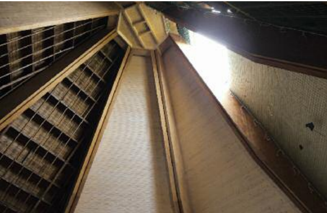
DACHKONSTRUKTION INNEN WÄHREND RENOVIERUNG