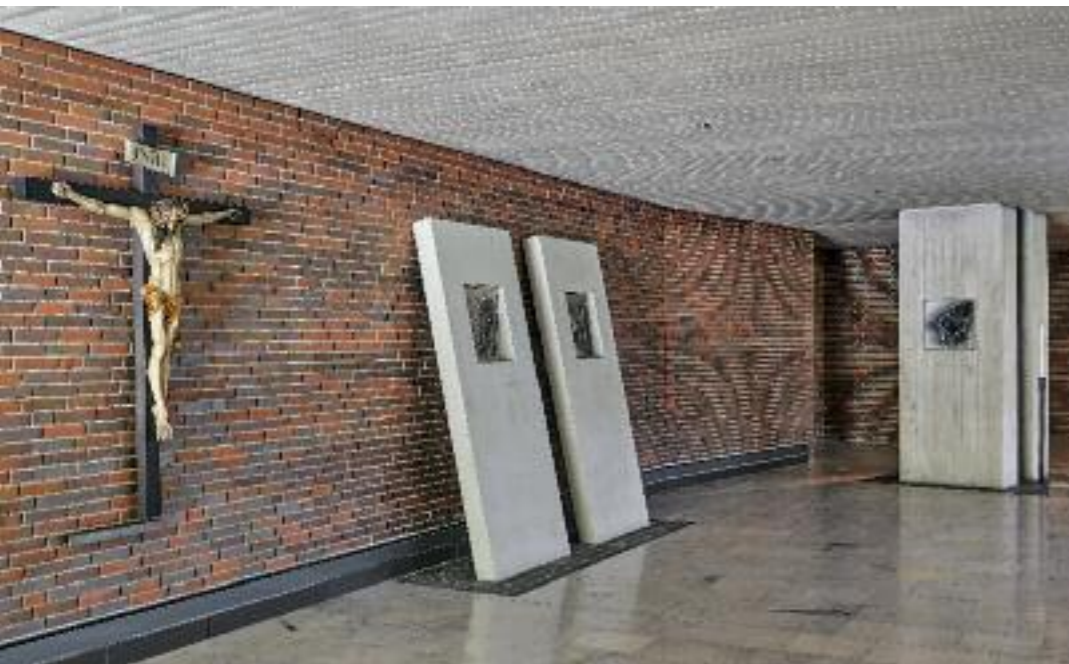
KREUZWEG MIT KRUZIFIX AUS NOTKIRCHE