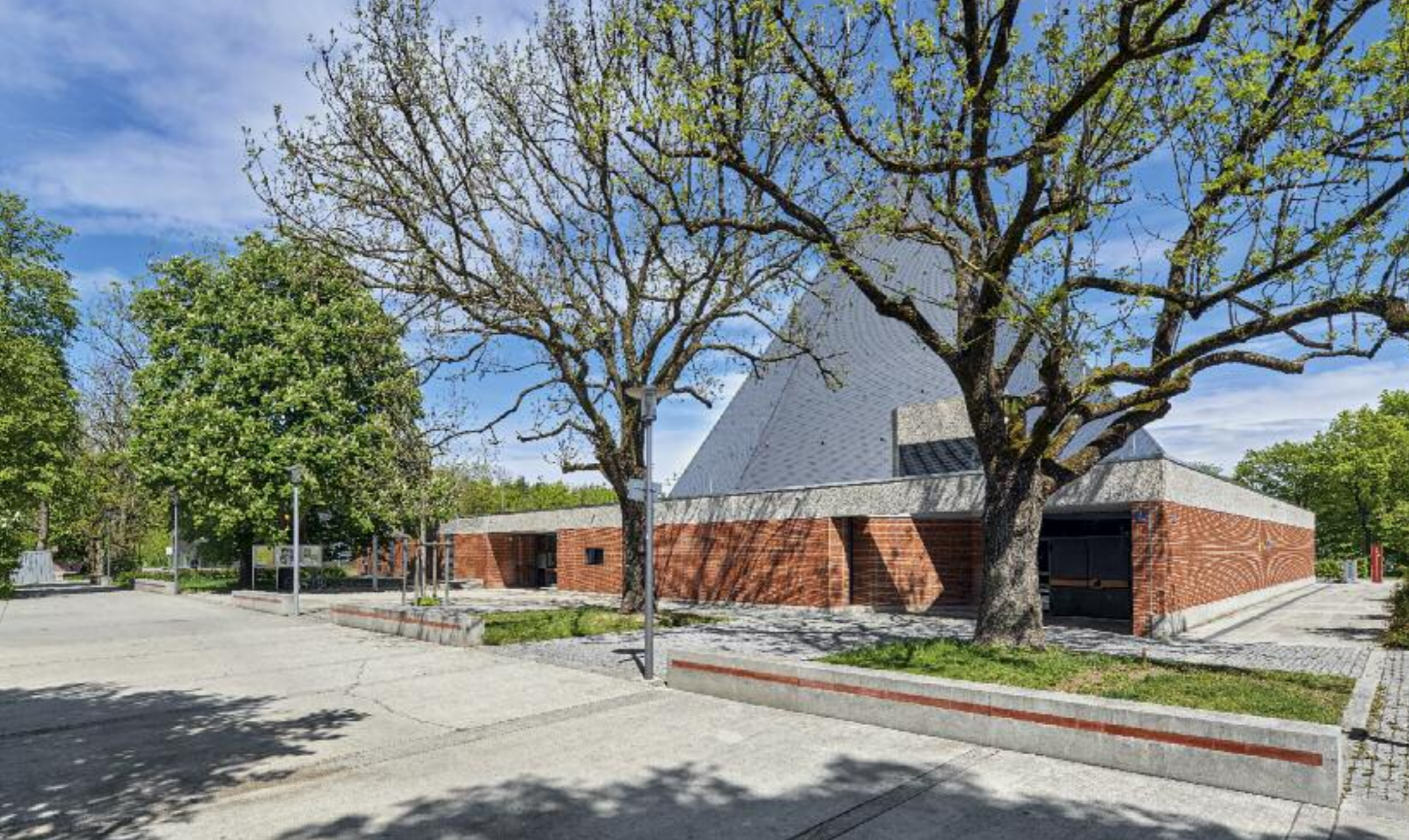
AUSSENANSICHT MIT KIRCHPLATZ UND „SCHLEISSHEIMER BAND“