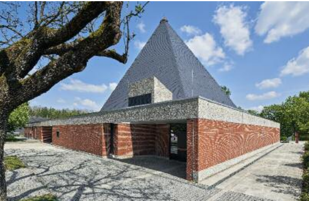
AUSSENANSICHT MIT SÜDWESTEINGANG