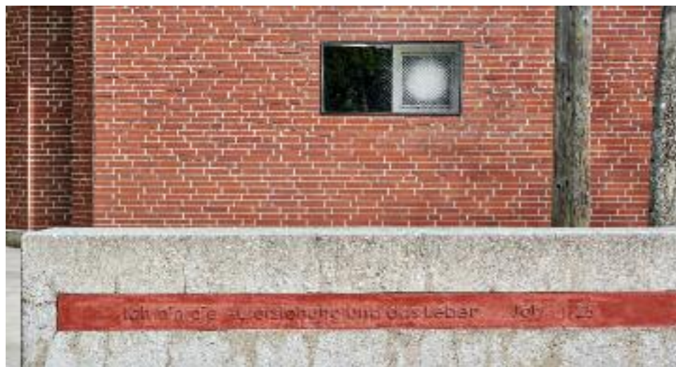
AUSSENANSICHT MIT KREUZWEG, STATION AUFERSTEHUNG