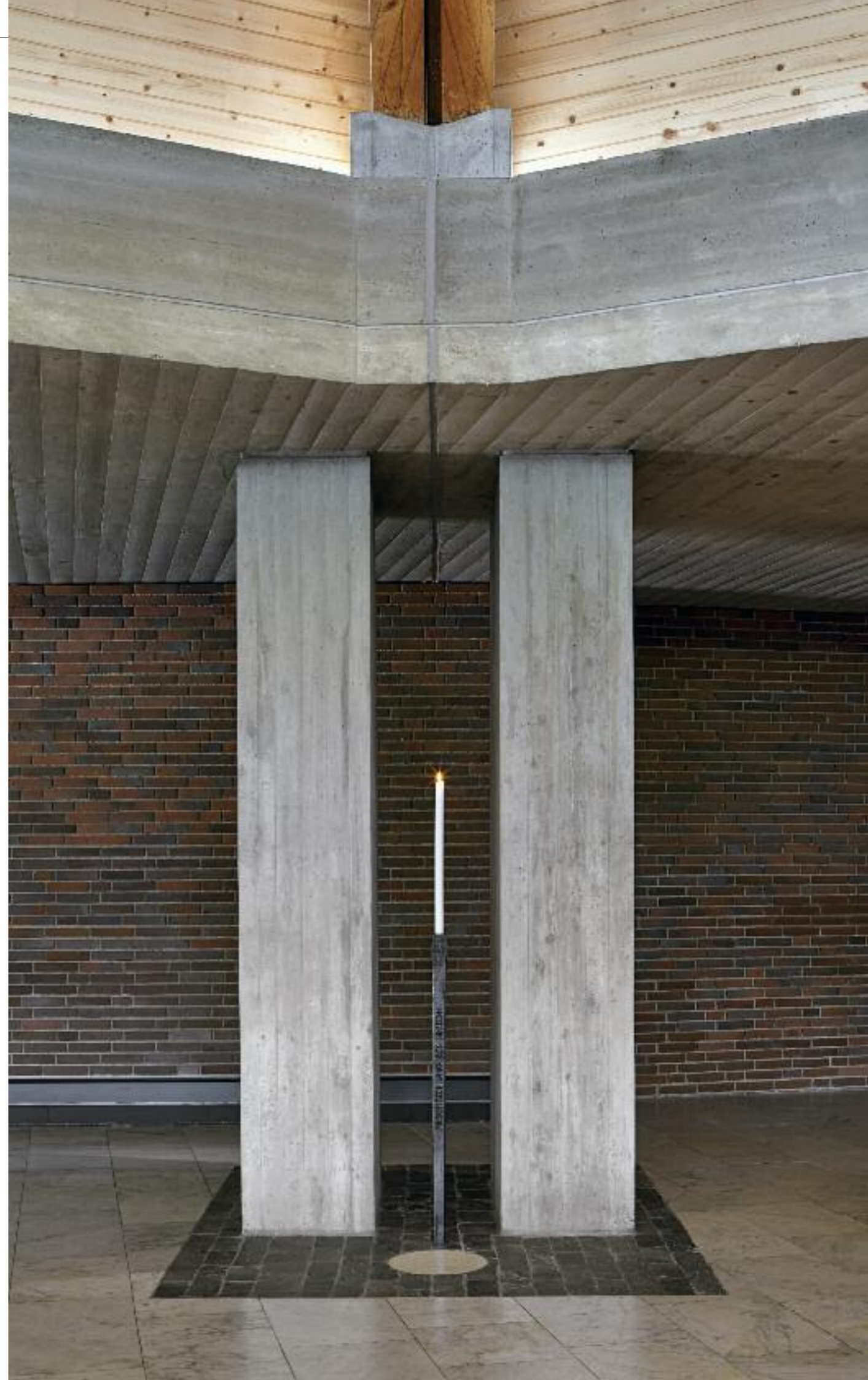
DETAIL DOPPELSTÜTZE MIT SIEBEN-SCHMERZEN-LEUCHTER

In dieser subtilen Austarierung zwischen klarem liturgischen Raum und sinnlicher Architektur und Bildsprache entsprach Franz Ruf in beispielhafter Weise dem Wunsch des Bauherrn Kurat Hans Schachtner: „In der heutigen Ausschließlichkeit modernen Bauens, zwischen strukturellem Funktionalismus oder suchender Bildhaftigkeit sollten wir uns mühen um eine sparsam geformte und gültige Bildaussage im Ganzen und in den Einzelteilen.“