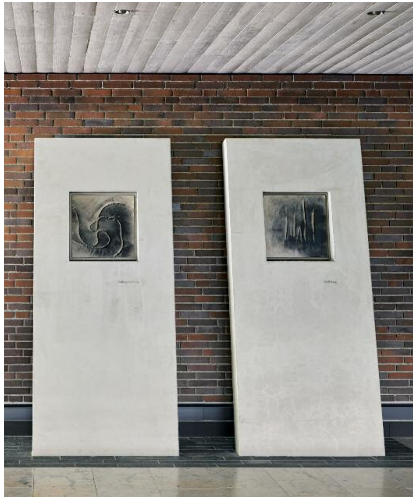
KREUZWEG, STATIONEN GEFANGENNAHME UND GEISSELUNG

Der traditionellen Folge von 14 Stationen, beginnend mit der „Verurteilung“ und endend mit der „Grablegung“, sind die „Gefangennahme“ und die „Geißelung“ vorangestellt, weil „hier der Erfolgskurs Jesu jäh beendet wurde“ (Schmidt). Als letzte Station ist die „Auferstehung“ angefügt, eine seit den 50er-Jahren des 20. Jahrhunderts verbreitete, motivische Erweiterung als Ausdruck, dass der Leidensweg Jesu nicht im Tod endet, sondern in die Erlösung der Auferstehung mündet. Die ca. 50 x 50 cm großen, monochromen Bilder sind in einer speziellen Papierprägetechnik ausgeführt. Das angefeuchtete Papier wird wie eine empfindliche Haut auf reale Materialien gepresst. Die daraus rührende haptische Oberflächentextur wird durch die flach aufgesprühte, schwarze Farbe malerisch unterstrichen und in ihrer Reliefierung intensiviert. Der Begriff der „Einprägbarkeit“ ist wörtlich genommen. Schmidt greift in zeitgenössischer Interpretation das alte Thema der „arma Christi“ auf, der Leidenswerkzeuge, die Jesus in seiner Passion begegnen. Das geprägte Papier hat die Last der Passion physisch in sich aufgenommen. Das „verwundete“ Papier wird zum Sinnbild für die Verletzlichkeit und Brüchigkeit des menschlichen Lebens.