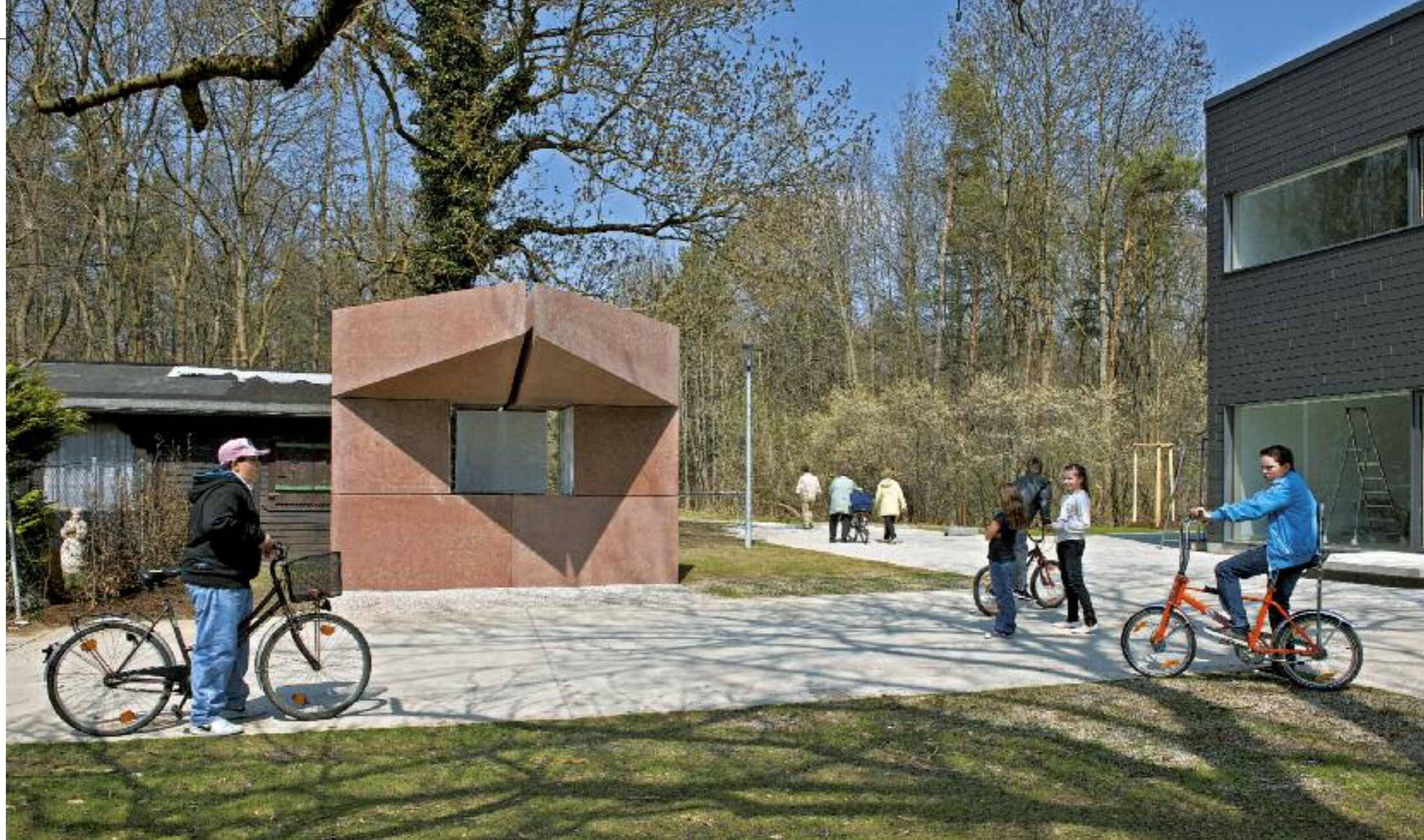
„MACHT BARMHERZIGKEIT“. STATION II, „HUNGRIGE SPEISEN“

Der letzte Sitzblock steht kurz vor dem „Flaucherkreuz“ (alte Stadtgrenze Münchens) und führt seit 2010 auf die von Heim Kuntscher Architekten errichtete zweite Station des Ökumenischen Pilgerwegs „Macht Barmherzigkeit“ hin. Der aus rötlichem Sichtbeton gefertigte Baukörper spielt in seiner Gestalt geschickt mit den Motiven Stadttor und Marterl. Unter dem vorkragenden Giebel befinden sich drei weiß emaillierte Reliefs von verschiedenen Getreideähren (Alix Stadtbäumer, München), die auf den Titel der Station „Hungrige speisen – satt werden“ und damit auf die diakonische Arbeit der „Münchner Tafel“ und des benachbarten „Lichtblick Hasenberg!“ sowie die wöchentliche Armenspeisung der Pfarrei verweisen.