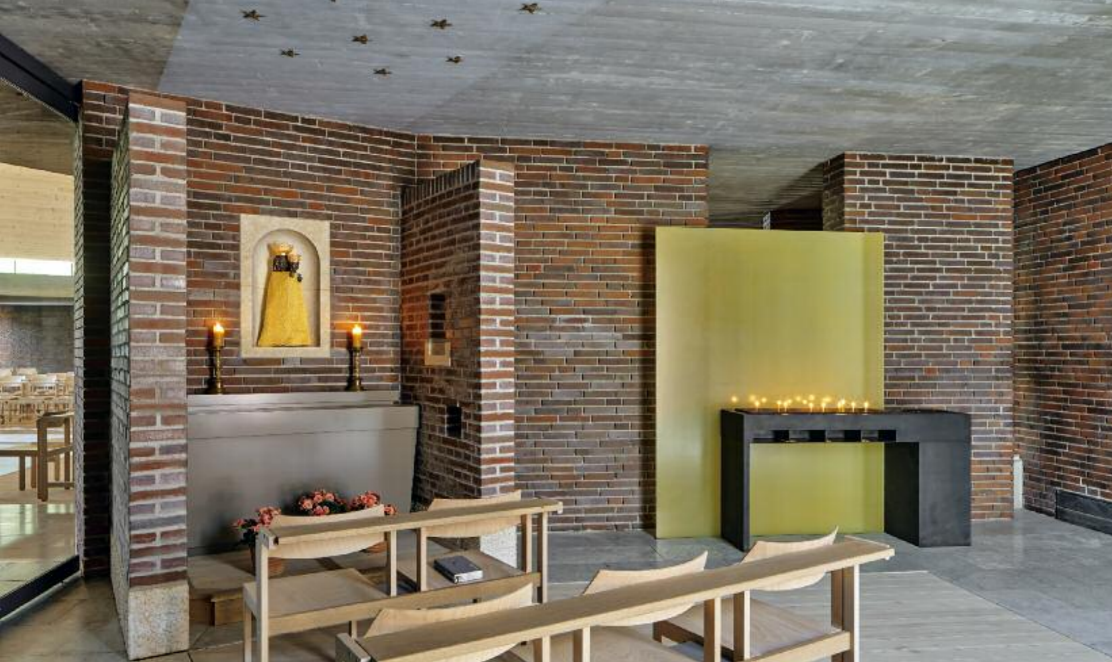
„LORETO-KAPELLE“. ORT DER PERSÖNLICHEN ANDACHT