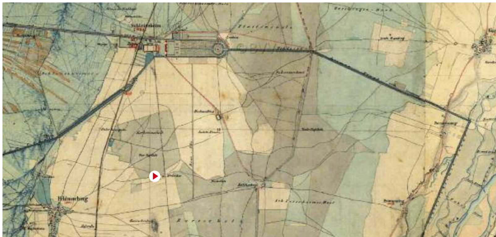
TOPOGRAPHIE MÜNCHNER NORDEN. HISTORISCHE KARTE VON 1856