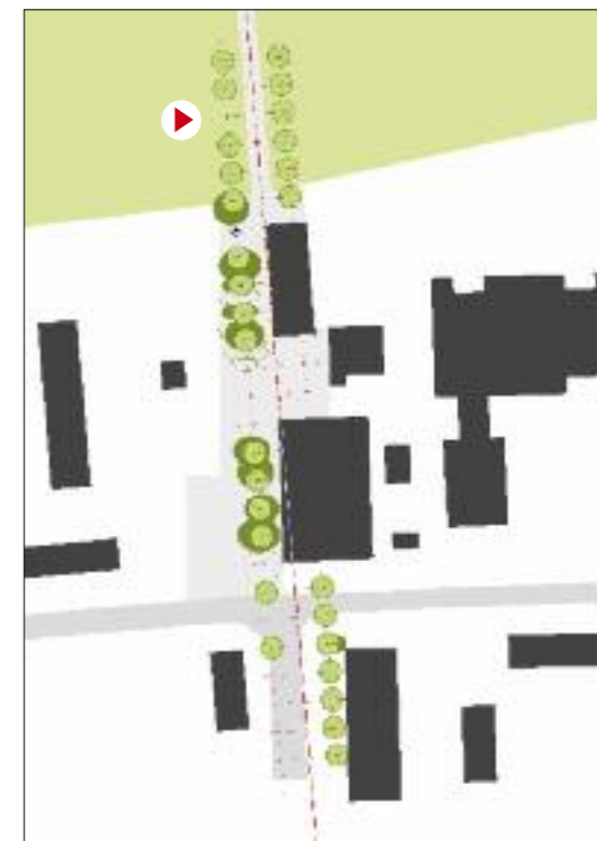
TOPOGRAPHIE MARIÄ SIEBEN SCHMERZEN HEUTE

Diese von Ordensleuten aller in München vertretenen Orden bewohnte, aber darüber hinaus auch zeittypisch mit mechanischen Spiel- und Wasserwerken ausgestattete Anlage zählte zu den frühesten, fürstlichen Eremitagen in Deutschland. Zusammen mit den ebenfalls von Wilhelm V. errichteten Eremitorien in der „Wilhelminischen Veste“ (Herzog-Max-Burg) und in der Au (Neudeck) war der „Schleißheimer Klausenweg“ ein hoch bedeutendes Zeugnis katholischer Frömmigkeit am Vorabend des Dreißigjährigen Krieges.