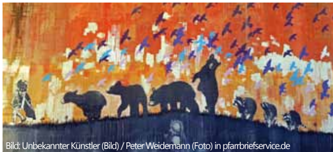
Bild: Unbekannter Künstler (Bild) / Peter Weidemann (Foto) in pfarrbriefservice.de

Die pädagogische Arbeit steht stets im Vordergrund. Für mich heißt das, die Verantwortung für die uns anvertrauten Kinder zu übernehmen und gemeinsam mit den Kolleginnen eine Umgebung zu schaffen, die es jedem Kinde ermöglicht, sich bestmöglich zu entfalten und zu entwickeln. Ich freue mich nun auf eine vertrauensvolle Zusammenarbeit und eine schöne Kennenlernzeit.