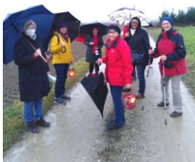
(Die Schirme sorgen auch für den Corona-Abstand!)