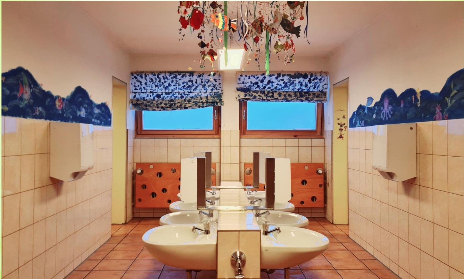
Waschraum für alle Kindergartengruppe - rechts und links kommen jeweils 3 Kindertoiletten