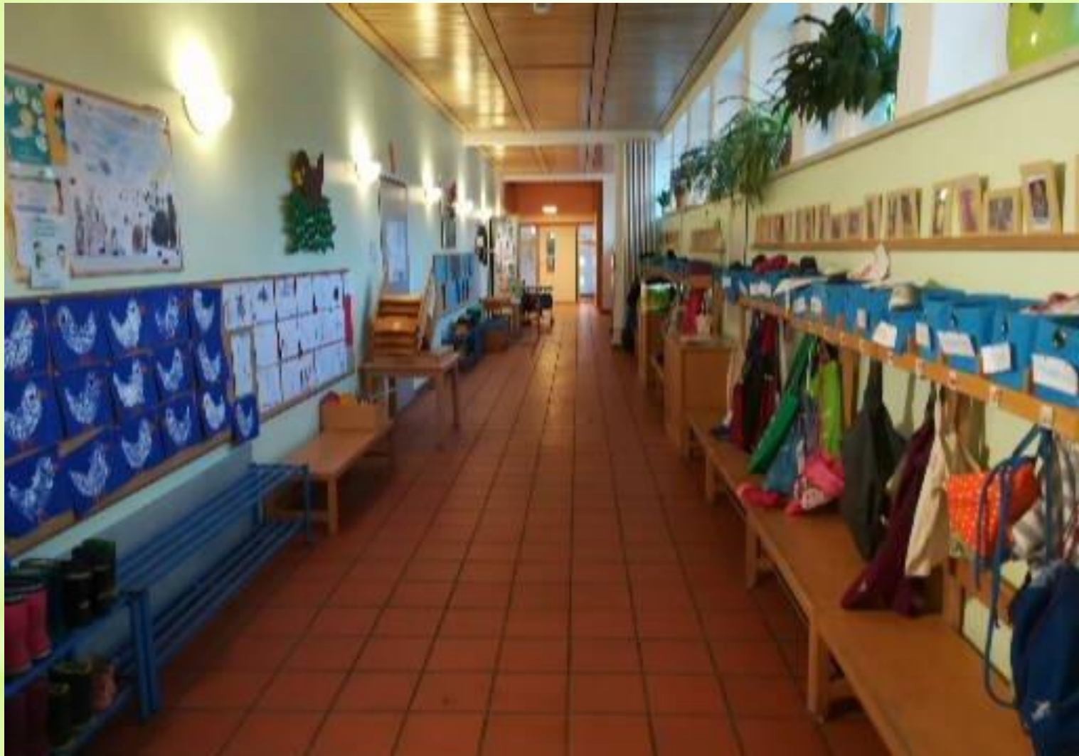
Gang und Garderobe der Spatzen- und Igelgruppe