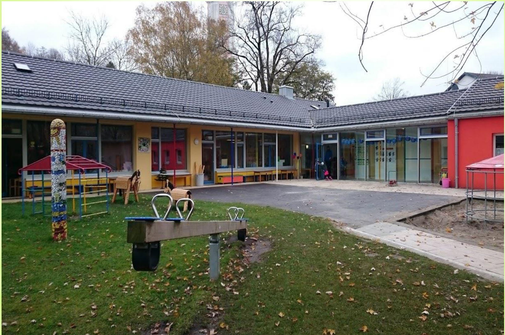
Gebäudeansicht von der Gartenseite