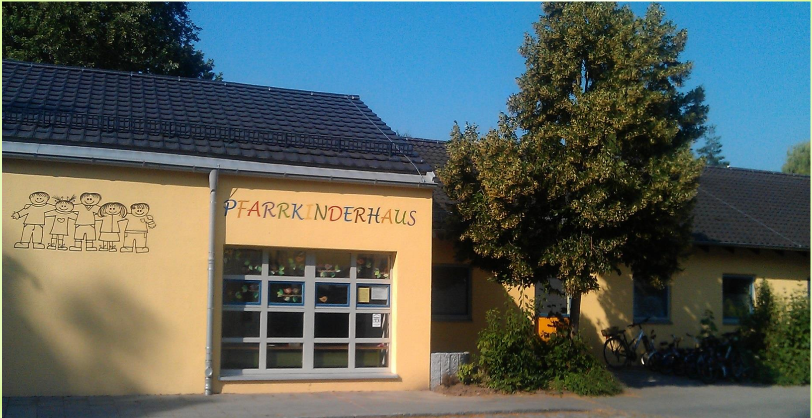
Gebäudeansicht von der Strogenstraße- Eingang Krippe