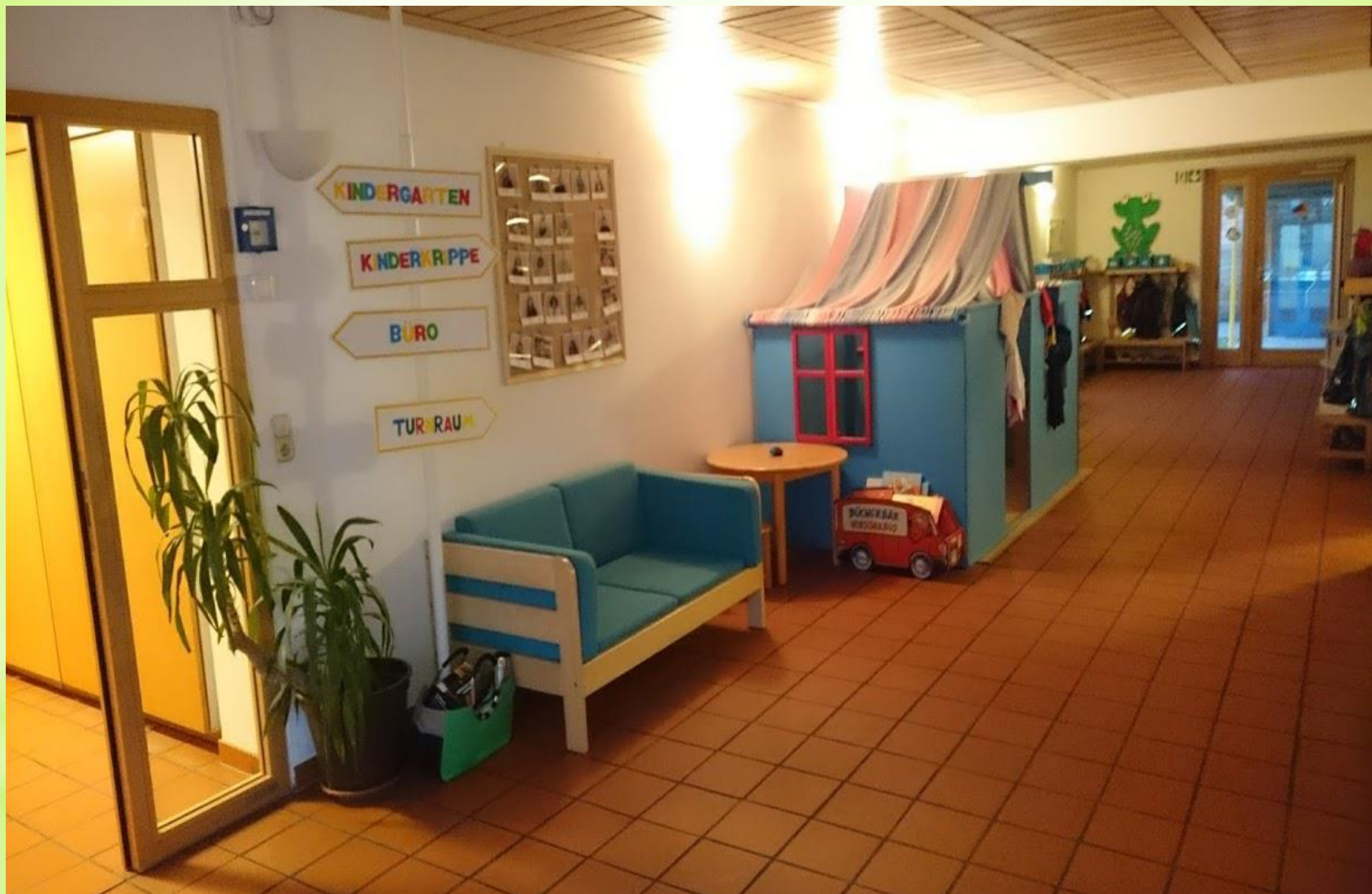
Gang zur Krippe mit Spielbereich für die Kindergartenkinder „blaues Haus“