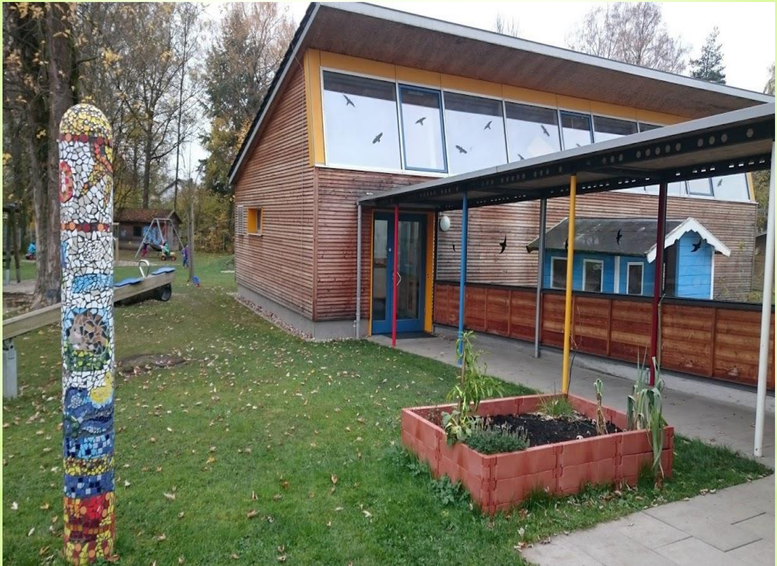
Unsere Turnhalle von außen