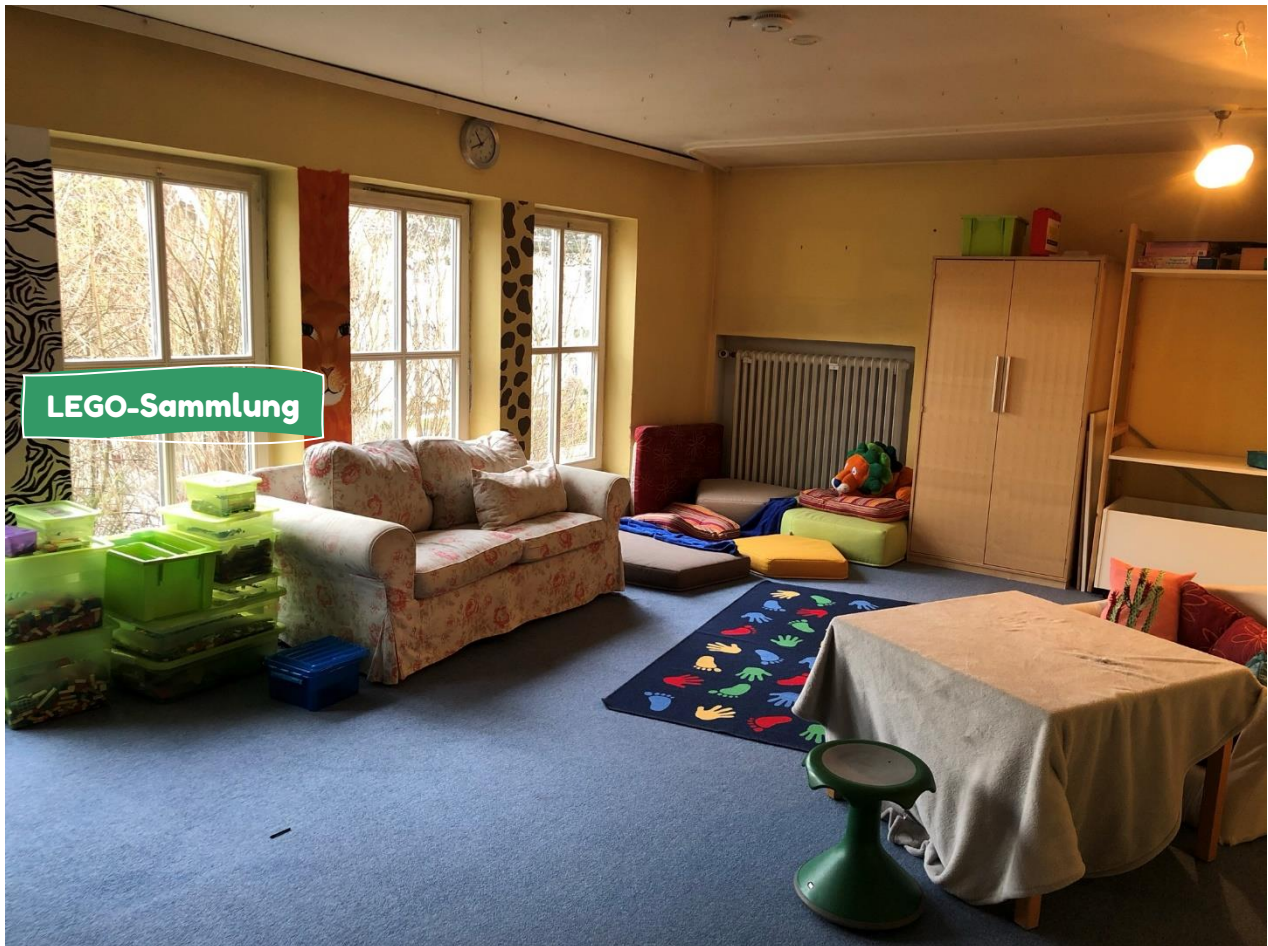
Auf der Bühne habt ihr viel Platz zum Spielen und Bauen mit unserer großen LEGO-Sammlung.