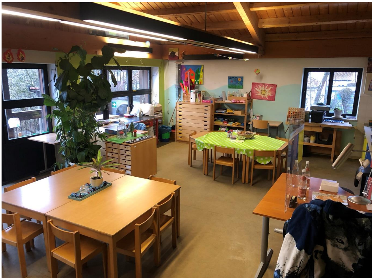
Der Gruppenraum der Drachengruppe mit Blick auf die große Kreativ-Ecke.