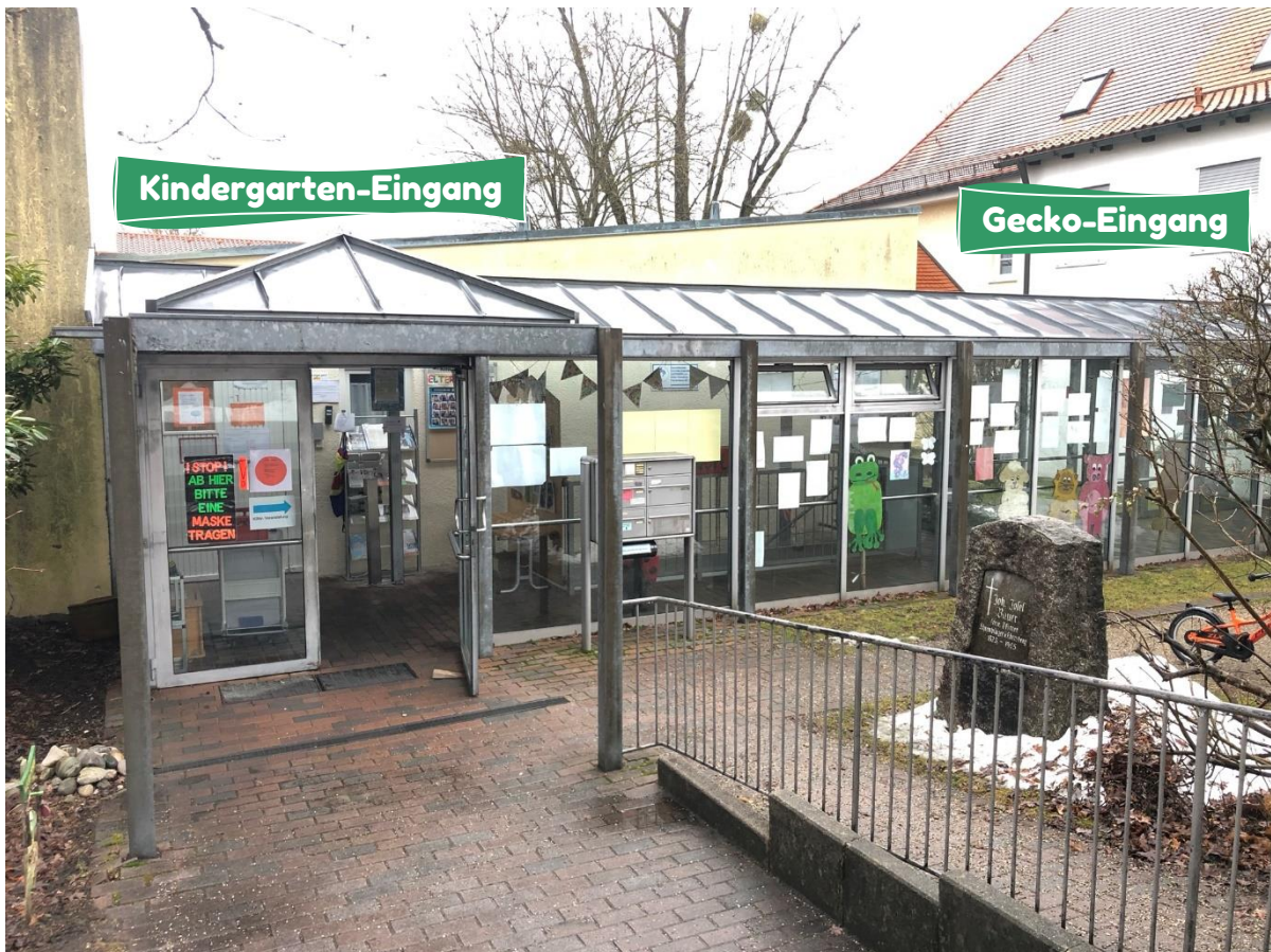
Das ist der eigentliche Eingang in die Geckogruppe. Den geheimen Flur dürfen eigentlich nur die ErzieherInnen und Kinder nutzen. 😊