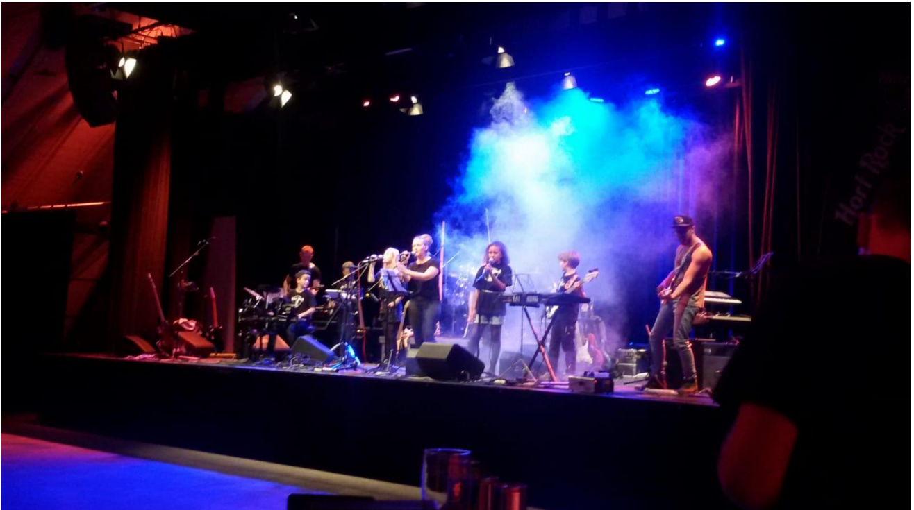
Das war die Hort-Band bei einem Auftritt im Alten Speicher in Ebersberg.