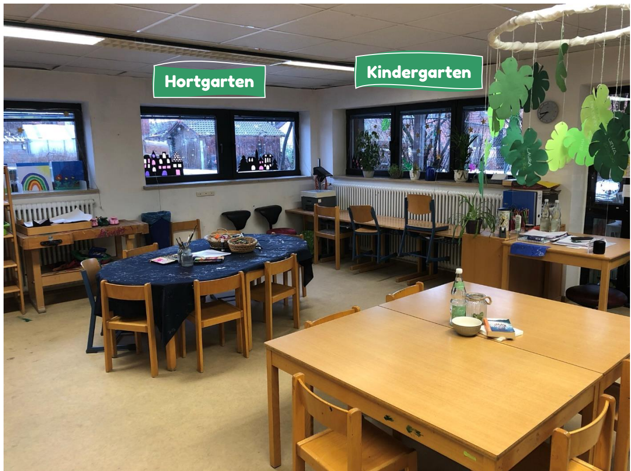
Hier seht ihr die Kreativecke mit Blick in den Garten vom Hort und Kindergarten.