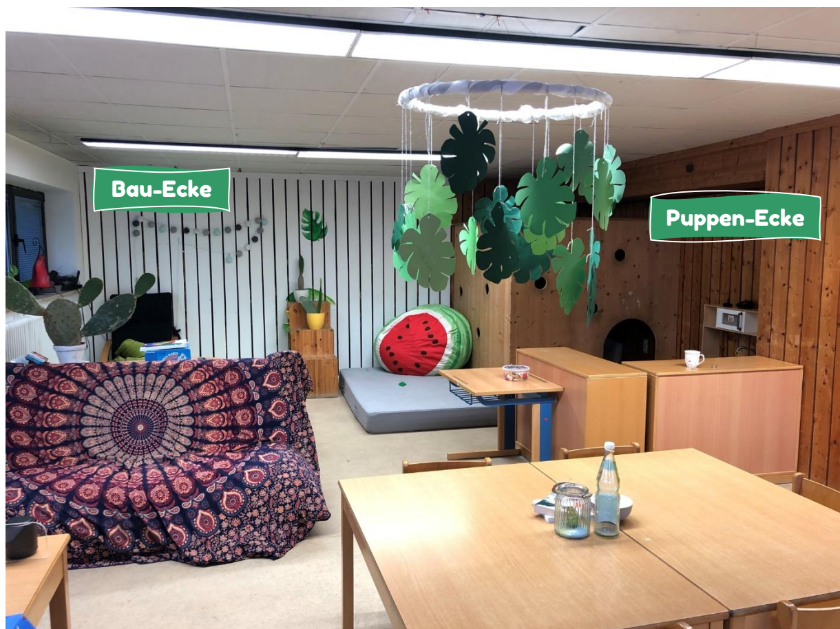
Eine Bau- und Puppenecke (mit Höhle) gibt es hier auch.