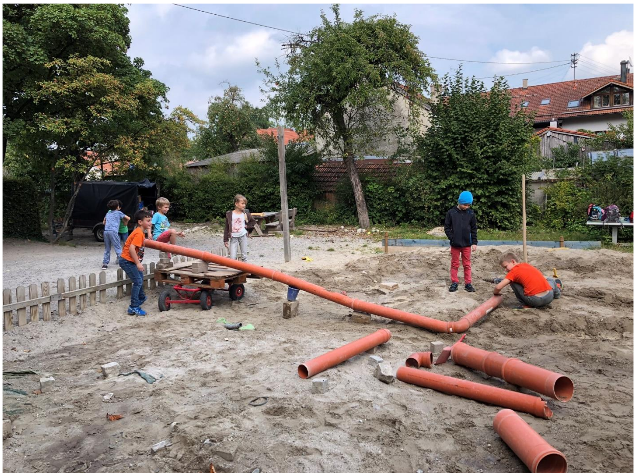
In unserem Garten findet ihr einen großen Sandkasten mit verschiedenen Materialien zum Bauen, zwei Schaukeln, zwei Holzpferde und vieles mehr.