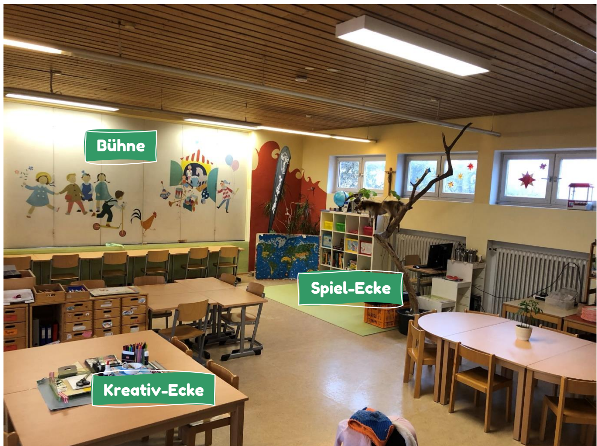
Im Gruppenraum der Geckogruppe gibt es eine Kreativ- und Spielecke (mit PC). Am Nachmittag machen wir hier Hausaufgaben. Hinter einer Schiebewand befindet sich noch die Bühne.