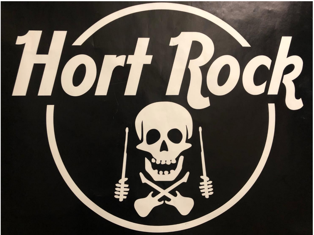
Das ist unser Band-Logo. 😊