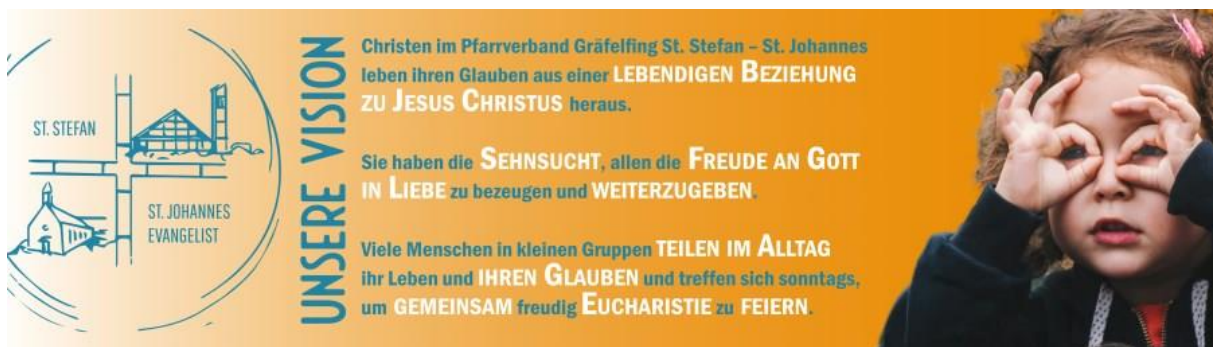
Abbildung 1: Vision des Pfarrverbands

Markus Zurl, Gregor Schweizer und Wolfgang Kustermann stellen jeweils einen Teil der Vision vor: