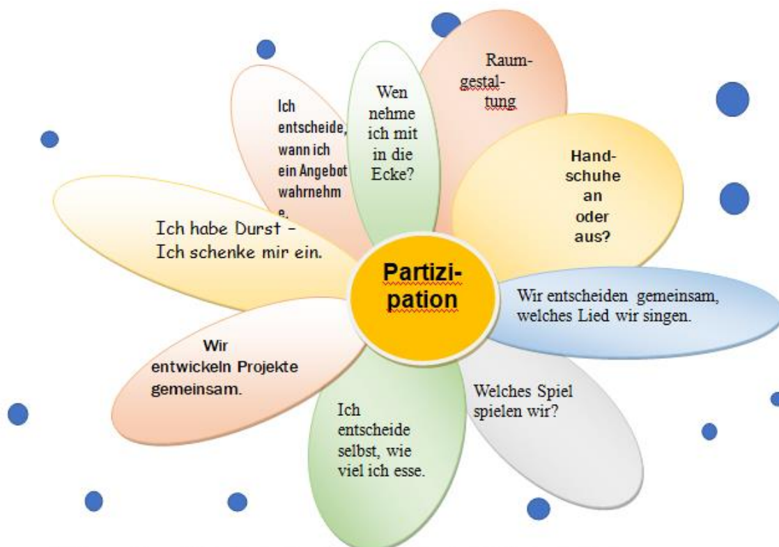
Abbildungserklärung: Die Partizipationsblume blüht immer mehr auf, wächst stets und wird voller.