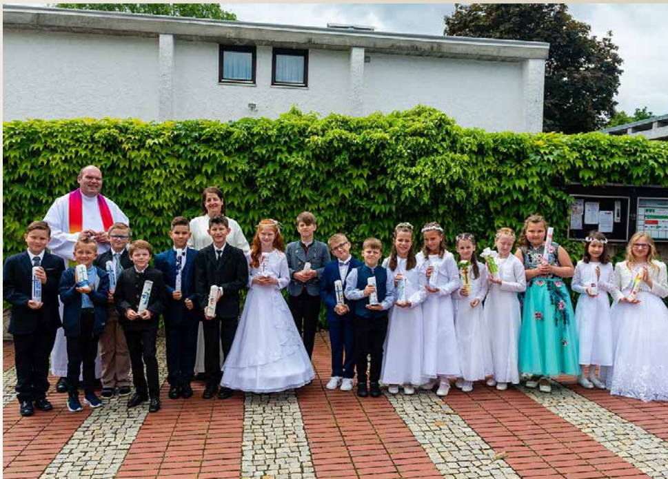
Erstkommunionkinder aus Wiederkunft Christi

Gott möchte den Menschen auf vielfältige Weise nahe sein. Das eindrücklichste und tatsächlich mit Sinnen zu greifende Zeichen ist dabei die Eucharistie: Jesus Christus verschenkt sich selbst im Leib Christi.