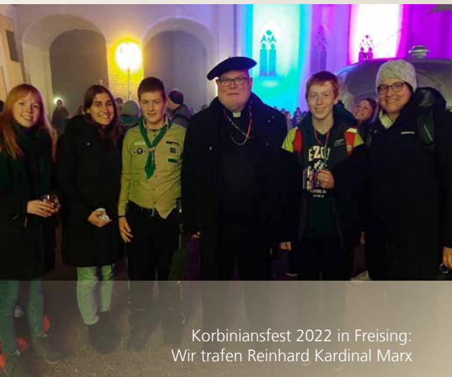
Korbiniansfest 2022 in Freising: Wir trafen Reinhard Kardinal Marx