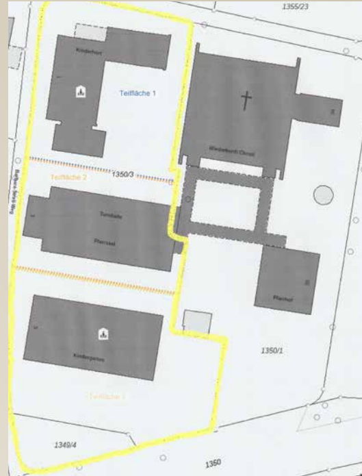
Die neue Aufteilung der Pfarrei Wiederkunft Christi: gelbe Markierung ist der Bereich, der ab dem 1. Januar 2023 an die Stadt Kolbermoor übergeht. Der Bereich rechts davon bleibt bei der Stadtkirche Kolbermoor.