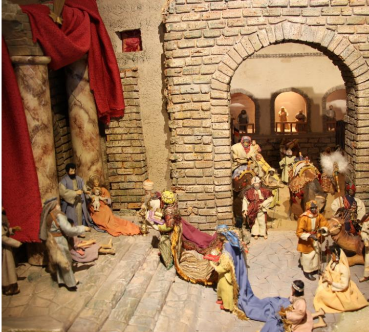
Foto von der Heigl-Krippe aus der Wallfahrtskirche, die heiligen Dreikönige bringen ihre Gaben dar.

St. Michael - Peiting Auferstehung des Herrn - Hohenpeißenberg