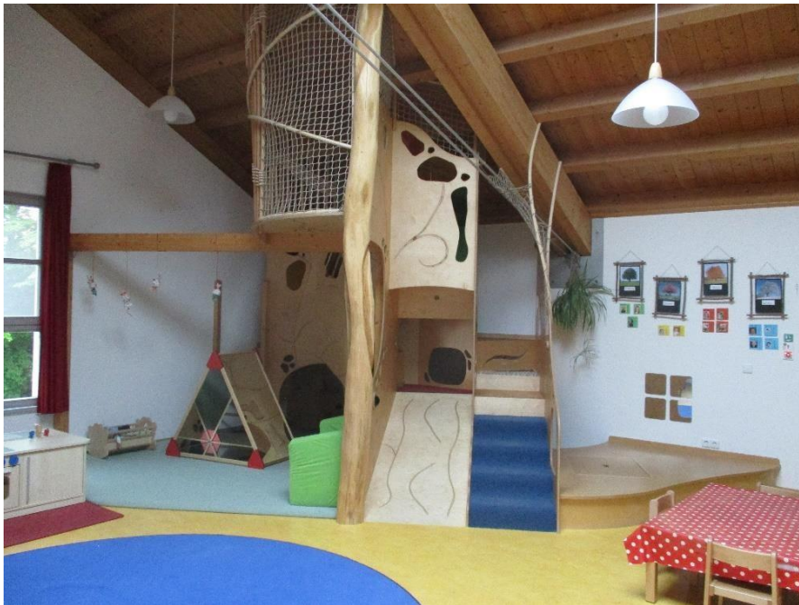
Bewegungseinbaute im Krippenraum

Außerdem haben die Kinder die Möglichkeit ab Oktober nach Einführung bestimmter Regeln die verschiedenen Spielbereiche in der Halle (immer wieder wechselnd: Kaufladen, Puppenhaus, Regenbogenbausteine, große Softbausteine, ...) gruppenübergreifend zu nutzen. Auch der neue Turnraum soll Kleingruppen von 2 – 3 Kindern während der Freispielzeit zur Verfügung stehen.