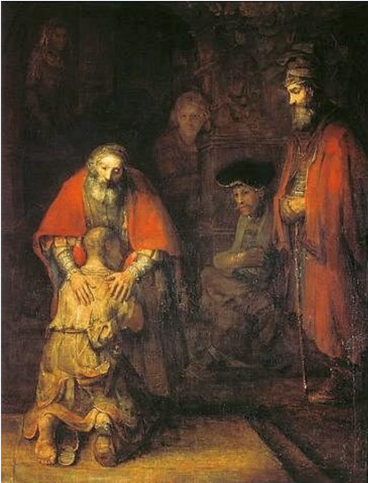
Rembrandt van Rijn: Die Rückkehr des verlorenen Sohnes aus 1669, Öl auf Leinwand, 260 x 203 cm, Eremitage Sankt Petersburg

St. Michael - Peiting Auferstehung des Herrn - Hohenpeißenberg