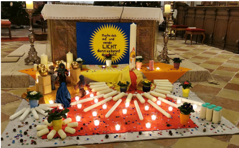
(Text: Irmi Huber)

Beim Lichtmessgottesdienst haben sich die Kinder vorgestellt. Unser Bild zeigt das Kerzenmandala in der Baumburger Kirche mit den Erstkommunionkerzen sowie verschiedenen Kirchenkerzen und der Osterkerze in der Mitte.