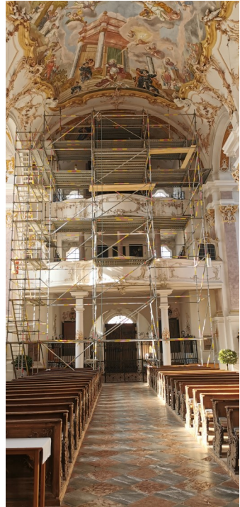
(Text: Jürgen Wolf)