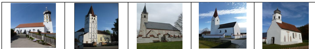
St. Martin Bergen