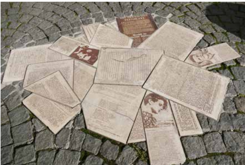
Mahnmal der Geschwister Scholl und für die Weiße Rose, vor der Ludwig-Maximilians-Universität, München.