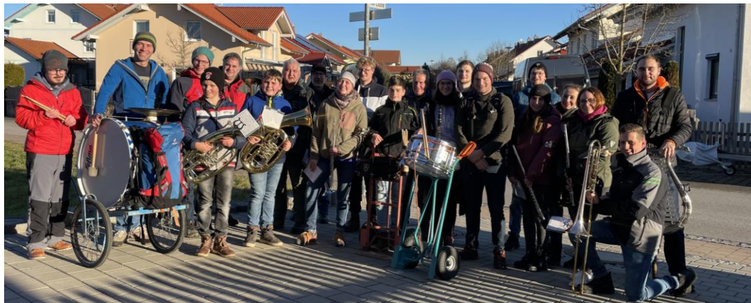
Knappschafts- und Trachtenkapelle Peiting und Hohenpeißenberg beim Neujahrblasen!