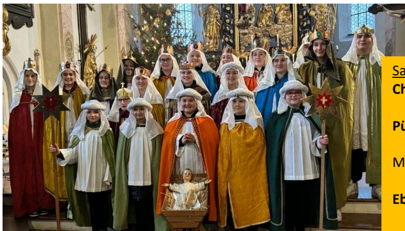
Die Sternsinger in der Pfarrei Pürten /St. Erasmus

GEMEINSAM FÜR UNSERE ERDE ☀️ IN AMAZONIEN UND WELTWEIT