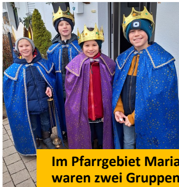
Im Pfarrgebiet Maria Schutz waren zwei Gruppen unter- wegs