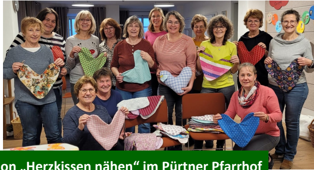
Aktion „Herzkissen nähen“ im Pürtner Pfarrhof

An einem Samstag im November nähten Frauen aus Pürten und Umgebung über 300 Herzkissen. Diese wurden an den Verein Herzkissen-München (Nicconhelf e.V.) gespendet. Dort werden die Rohlinge gefüllt und dann an die umliegenden Krankenhäuser an Brustkrebspatientinnen verteilt. Die Kissen