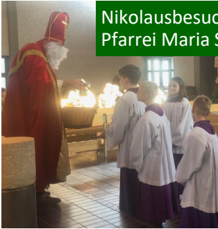
Nikolausbesuch in der Pfarrei Maria Schutz